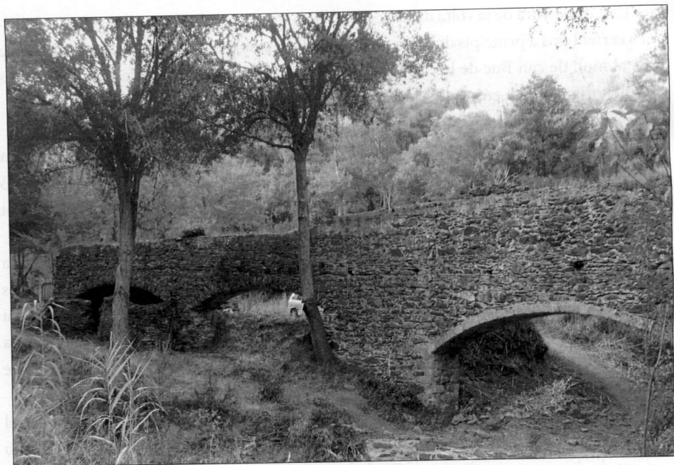
El molí d'en Jordà, també dit de la Taverna.

Destaca l'aqüeducte monumental que conduïa l'aigua fins al molí i que travessa la riera de la qual es subministrava forces metres més amunt donat el desnivell que s'ha de guanyar. Una de les arcades de l'aqüeducte, la més gran i més propera a la riba esquerra, és diferent a la resta per haver-se ensorrat, cosa que obligà a refer-lo, probablement cap al segle XVIII. 7