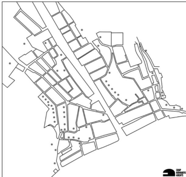
Plaol d'Arenys de Mar amb la senyalització dels refugis antiaeris de la Guerra Civil (1936-1939) localitzats fins al moment pel Grup Búnquers Arenys. Si bé alguns d'aquests refugis van ser construïts expressament a causa del conflicte bèl·lic, ja fos per iniciativa privada o pública, d'altres van aprofitar construccions anteriors.

En els últims mesos s'han mantingut contactes amb la regidoria de cultura per poder col·laborar en aquest projecte. Els bombers han mostrat el seu interès en participar-hi, tot donant-nos unes pautes d'intervenció i buscant la màxima seguretat a l'hora de realitzar aquesta feina.