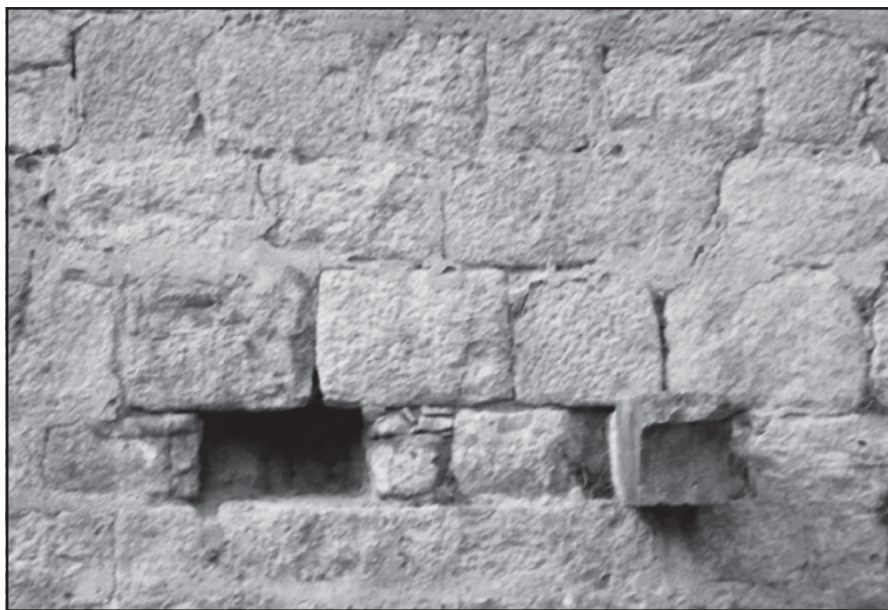
Foto 3: Roca Rossa - A dalt, fornícula de l'interior de la nau, A baix, mènula del claustre.