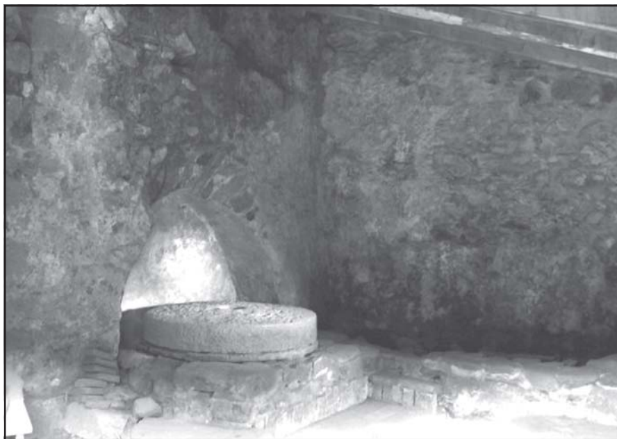
Interior de l'obrador del molí de Can Marquès a Sant Pere de Riu, un cop restaurat.