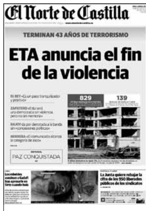
Tabla 7. Encuadre de testificación (fuerte)