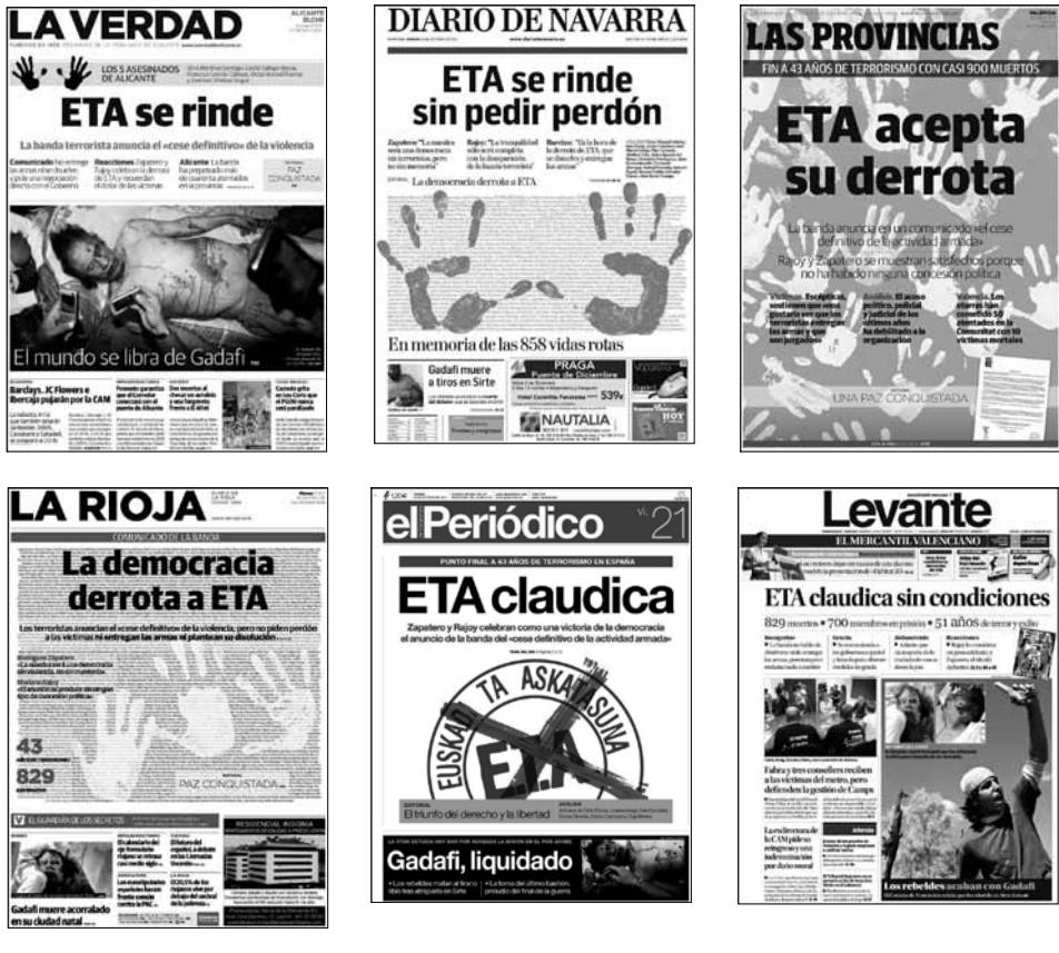
Tabla 3. Encuadre de vencimiento