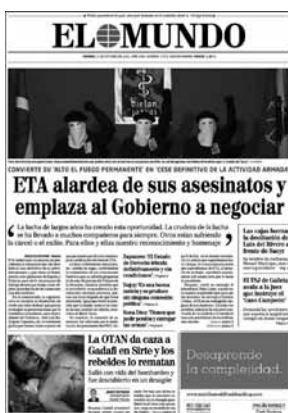
Tabla 9. Encuadre de condición

En el encuadre noticioso que El Mundo realiza del comunicado se prescinde del cese de la actividad armada como eje fundamental de la información y se desplaza el interés hacia las condiciones que, desde el punto de vista de este medio, ETA impone al Gobierno para que dicho cese se haga efectivo.