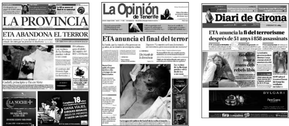
Tabla 8. Encuadre de testificación libre

Aunque quizá no sea una sensación deliberadamente buscada, el diseño de las portadas de algunos de estos diarios, como El Faro de Vigo , La Provincia , La Opinión y El País , suscita un efecto paradójico al relacionar el titular de abandono del terror con la foto del cadáver de Gadafi, visiblemente mancillado. El anunciado fin del terror junto a esa imagen tan impactante de los restos de Gadafi resulta tan antitético que podría generar cierta incredulidad sobre ese final del horror anunciado.