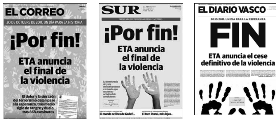
Tabla 4. Encuadre de desenlace (temporal)

El uso simbólico del color es evidente en casi todas las portadas. Así, el blanco y el rojo juegan como opuestos, sugiriendo la paz o la violencia como motivos a destacar.