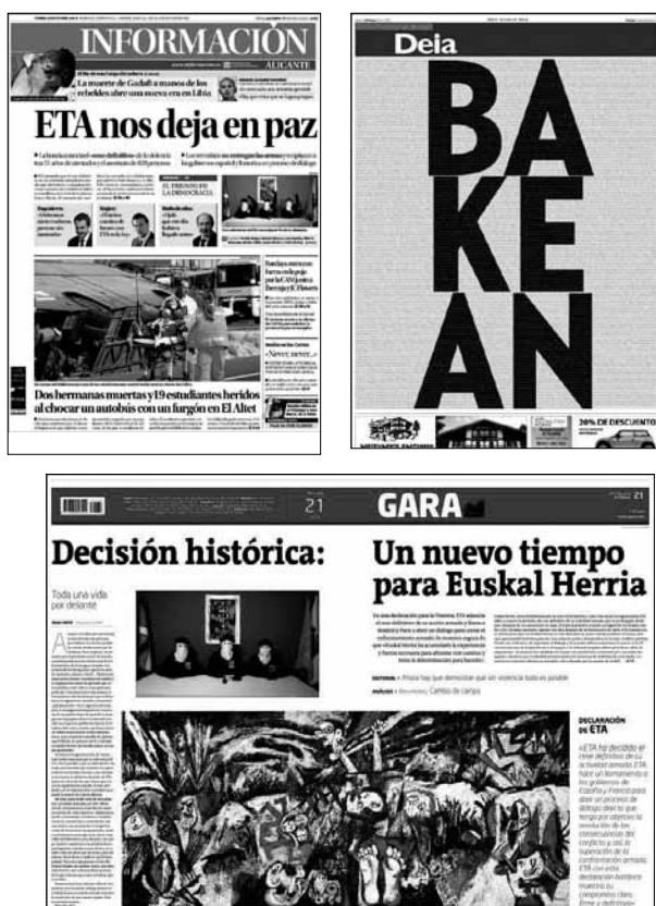
Tabla 6. Encuadre de consecuencia