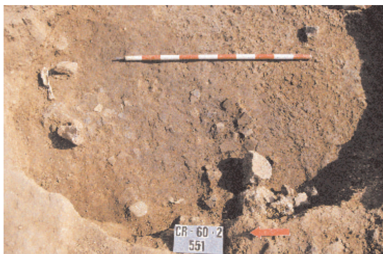
Fig. 3. Suelo de un horno exterior (CR-60) del yacimiento de Can Roqueta (Sabadell, Barcelona).

resulta difícil determinar de forma unívoca el uso que tuvieron todas y cada una de estas estructuras, pero sí que puede afirmarse la existencia de un modelo centrífugo de organización de las actividades de transformación y consumo alimentario, de producción textil y metalúrgica y de cobijo. Parece evidente que la organización material de los espacios de consumo y trabajo habría exigido una gran movilidad de sus habitantes en todo el área del asentamiento y que, con seguridad, gran parte de las tareas cotidianas, por no decir todas excepto el descanso, implicaba trasiegos de ida y venida entre los diferentes espacios y, probablemente, la realización comunitaria de