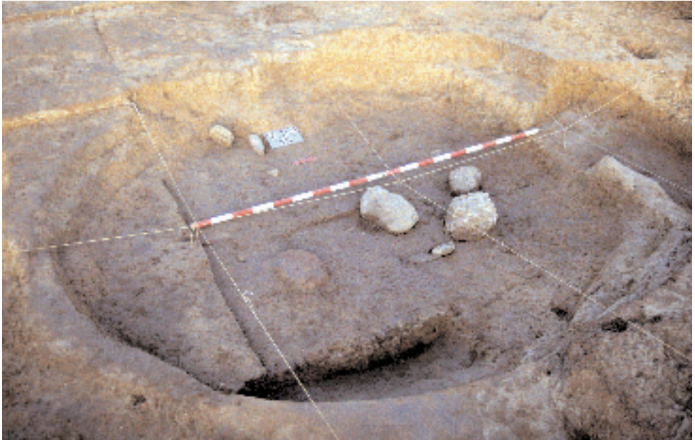
Fig. 1. Cabaña circular (CR-37) del yacimiento del Can Roqueta (Sabadell, Barcelona).