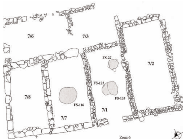
Fig. 4. Planta de la fase VI (325-225 a.C.) de la Zona 6 del yacimiento de Ullastret (Girona) (Martín 2000: 74, fig. 7.12).

donde se localizó un horno metalúrgico circular de arcilla junto al que aparecieron numerosas escorias de metal. En la hilera central de estancias, otros dos hornos dedicados a la cocción de alimentos se hallaban cerca de un pequeño recinto dedicado al almacenamiento, junto con numerosos fragmentos de ánforas púnicas, un mortero de piedra arenisca y piezas de cerámica de cocina. Probablemente se trataba de la zona de la casa dedicada a la preparación de los alimentos. Esta casa compleja tiene paralelos en el mismo Puig de Sant Andreu, en un edificio que rodea un patio porticado en el ángulo suroeste de la muralla. En ambos casos se trata de estruc-