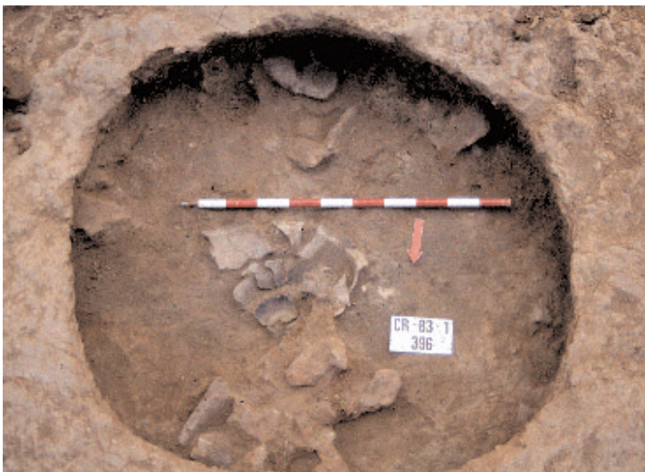
Fig. 2. Fosa doméstica amortizada como basurero (CR-83) del yacimiento de Can Roqueta (Sabadell, Barcelona).