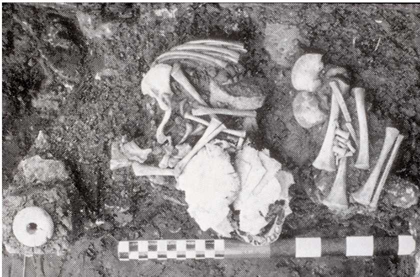
Fig. 5. Fotografía del enterramiento infantil procedente del sector sudoccidental de la casa alargada (AD-AF) en el poblado medieval abandonado de Upton. Publicada en Transactions of the Bristol and Gloucestershire Archaeological Society 88 (1969).