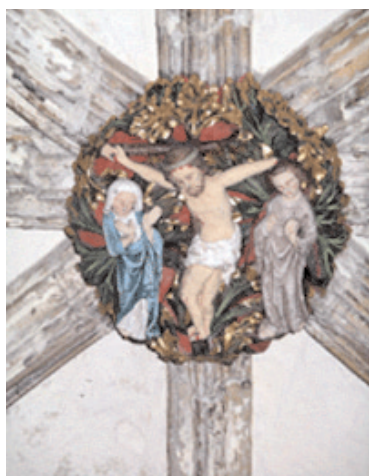
Fig 1. Clave de bóveda labrada del claustro oriental de la catedral de Norwich, de 1330 aproximadamente, que muestra la iconografía de la crucifixión. A la izquierda de la cruz puede verse a la Virgen María con las manos levantadas en un gesto de desesperación.

gesto de dolor. El sepulcro era lo suficientemente grande como para recibir a una mujer posteriormente, y es muy probable que la trenza de cabello perteneciera a este miembro de la familia, quizás su mujer, su hija o su madre.