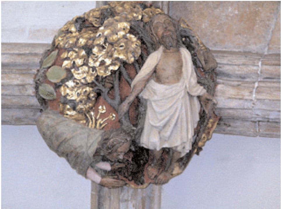
Fig. 3. Clave de bóveda del claustro septentrional de la catedral de Norwich, de aprox. 1430, mostrando a Cristo apareciendo en el paraíso después de su resurrección desde la tumba. Después de reconocerle como Cristo resucitado, María Magdalena se arrodilla a sus pies y los acaricia con su pelo.

En su papel como madre y comadrona, las mujeres en la Edad Media se enfrentaban a la muerte con mucha frecuencia. La mortalidad infantil debía ser de un 50-60%, aunque encontramos escasa representación de recién nacidos y criaturas en las excavaciones de cementerios medievales. En alguna ocasión