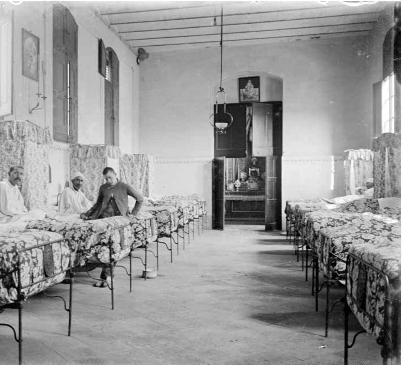
Pacients recuperant-se en un hospital, 1910-1920.