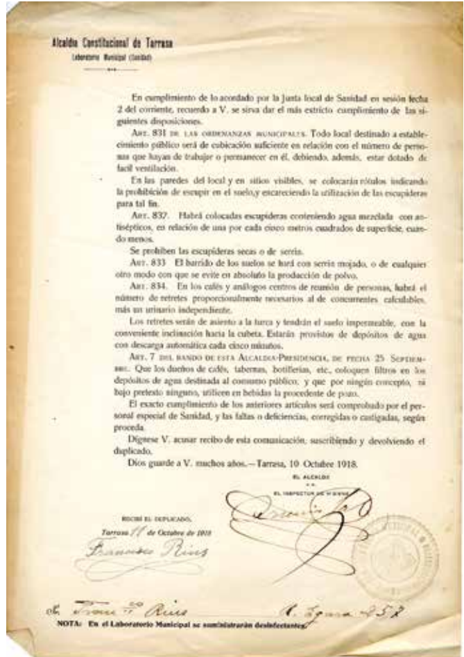
Recordatori dels preceptes higiènics de les ordenances municipals. AHT-ACVOC. Capsa 2885. 5 Sanitat, 5-7 Laboratori Municipal Parc de Desinfecció.