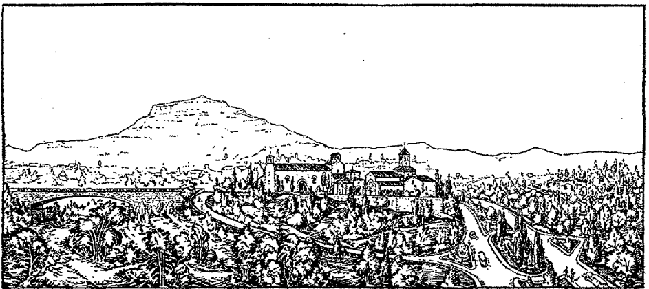
«Projecte d'adaptació de les escoles Roca i Roca al parc de Vallparadís», 16 de juny del 1936. (AHCT, Fons Urbanisme, Projectes no realitzats, exp. 294/36).

Una mostra d'aquesta voluntat de millora del torrent la trobem l'any 1936, en què s'acorda procedir a la urbanització i el sanejament del Sot del Pi i del carrer del Castell, alhora que es col·loca la primera pedra del que havia de ser el Grup Escolar Roca i Roca, a l'extrem del Passeig. Com tants d'altres projectes, el desfermament dels conflictes socials de l'època en va interrompre el desenvolupament. 4