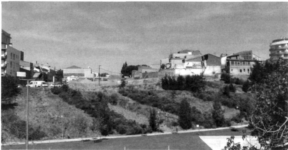
Un exemple de la transformació de les vores del parc: la substitució d'antigues indústries per noves promocions immobiliàries al carrer del Cementiri Vell.

Vallparadís, per la seva situació i extensió, per la seva tradició històrica, havia de ser un espai singular, havia d'esdevenir un símbol per a la ciutat i calia diferenciar-lo de la resta d'espais enjardinats dotats d'un paper tradicional. El model de gestió que s'adopta respon, doncs, a aquesta intencionalitat i s'opta per dotar el parc d'una estructura organitzativa pròpia, autònoma de parcs i jardins i que centralitza totes les activitats del parc: manteniment, seguretat, activitats esportives, equipaments, programació cultural, etc. Aquest model de gestió és el que es recull al Pla Director del Parc de Vallparadís de l'any 1999. L'Oficina del Parc esdevé l'eina dinamitzadora clau que «dóna vida» al parc i transcendeix la seva contundent realitat física. Si l'hem de jutjar per les xifres aconseguides (per exemple, una estimació de 277.000 participants en activitats al parc l'any 2003 17 , l'èxit d'aquest plantejament sembla indiscutible.