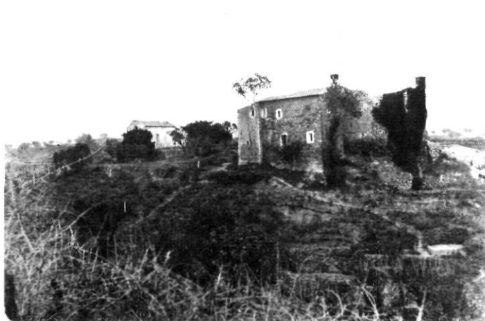
Imatge de la desapareguda capella de Sant Jaume de Vallparadís. Finals del segle XIX. Autor desconegut. Arxiu Tobella.

La primera alteració moderna que patirà la fesomia del torrent i que va tenir unes conseqüències profundament importants, perquè avui dia encara les podem apreciar, va ser l'any 1856. L'arribada del ferrocarril va ser el primer canvi modern en la fesomia del parc i completament determinant, ja que va escaparçar pel nord els dos braços del parc: un de semireomplert i en situació encara avui dia d'abandonament (al nord