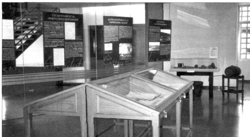
Vista de l'exposició «Sant Pere de Terrassa (1800-1904). L'altra cara de la industrialització» que s'ha exhibit al vestíbul de l'AHCT entre el 2 de juny i el 15 d'octubre del 2004.

L'Ajuntament de Sant Pere de Terrassa fou instituït l'any 1800 mitjançant una reial mandatòria de Carles IV. Durant els següents 104 anys, l'antiga Universitat Forana de Terrassa (formada per les parròquies fora vila) prengué autonomia jurídica i jurisdiccional respecte del terme terrassenc. Al llarg del segle XVIII, els interessos contraposats entre hisendats i oligarquia vilatana havien generat nombroses disputes, de les quals es conserven còpies encara al fons històric municipal de l'Ajuntament