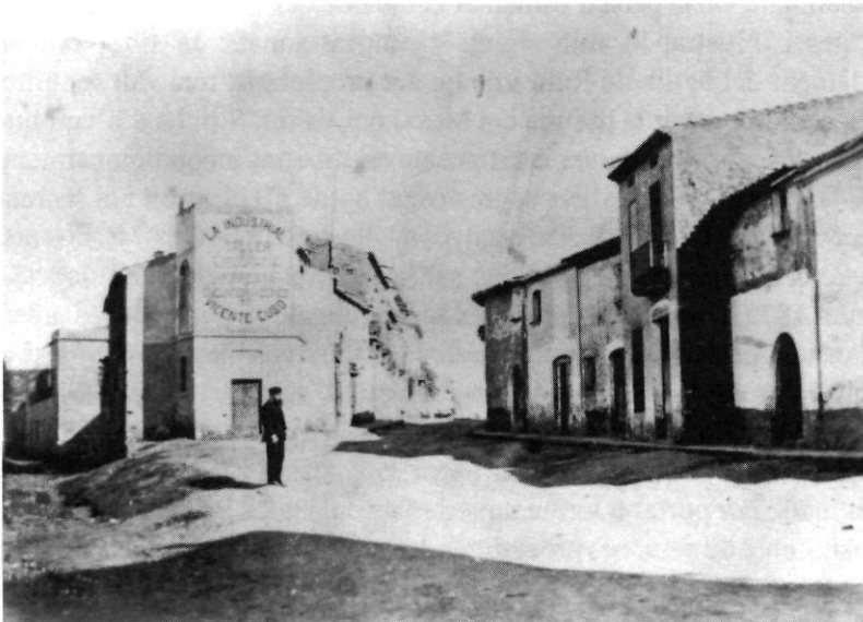
La Terrassa de la fi del segle XIX: confluència del carrer del Nord amb el carrer de Sant Leopold, vers 1898.

S'ha de mencionar que la tàctica dels carlins d'oposar-se amb tots els mitjans al govern legalment constituït va arribar a l'extrem d'acceptar aliar-se amb els seus enemics republicans. Havien anat junts, ocasionalment, als comicis electorals, però amb la fi de la Primera República i l'inici de la Restauració borbònica, que no interessava ni els uns ni els altres, la seva aliança es fa més estreta i es formen partides mixtes, que a la documentació es denominen carlo-republicans o carlofederal. La unió d'aquests dos antagonistes ens pot donar una idea de la creixent debilitat que manifesten davant la pressió de l'exèrcit. S'enregistren a la zona diverses notícies de la seva actuació: el diari de la Companyia Mobilitzada recull diversos intents per atrapar alguna d'aquestes partides mixtes: a Sant Cugat, el 20-03-1874; a l'Obac, el 27-07-1875; a Rubí, el 27 i el 31-08-1875, etc.; des de Castellbisbal també s'informa que la partida republicana del Noi de Badalona s'havia presentat a la població amb l'encàrrec de recollir quintos per ordre de R. Tristany, acreditant-ho amb un ofici idèntic al que feien servir els carlins (12-03-1874).