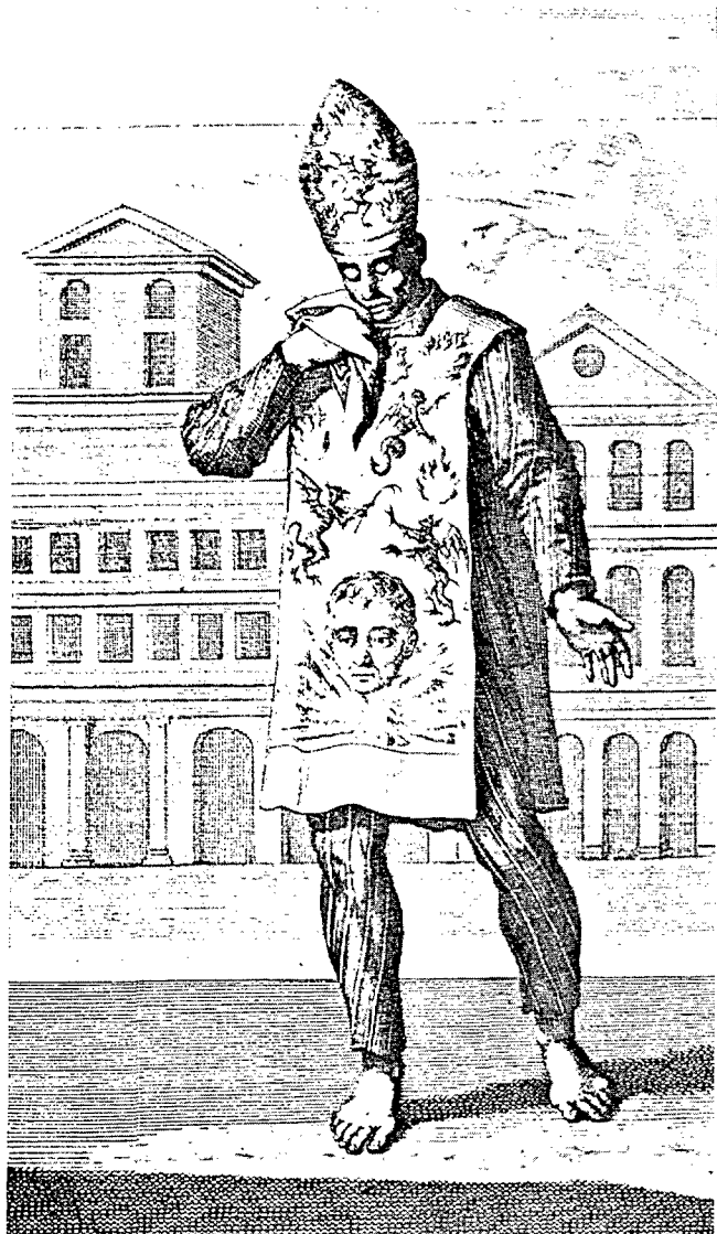
“Sambenito” i cucurulla d'un heretge relapse condemnat a morir. Ph. Limborch, Historia Inquisitionis . Amsterdam, 1692. Reproducció del llibre La Inquisición , Madrid, Ministerio de Cultura, 1982.

d'una forma progressiva, encara que no en tots els àmbits. El 1729, l'Ajuntament de Terrassa rebia una carta de la Reial Intendència de Catalunya en què es confirmava l'exempció dels familiars i els seus fills del pagament d'una part del cadastre. 38 Així mateix, deu anys més tard, els regidors de la vila de Terrassa notificaven que s'havia procedit a l'allotjament de tropes a les cases de familiars de la Inquisició, ciutadans normalment exempts d'aquesta prestació. 39