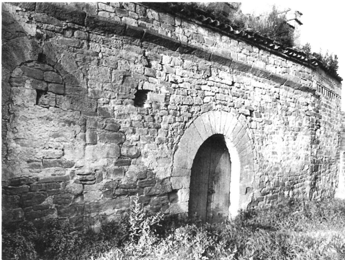
Església Vella de Rellinars. Façana sud de l'església preromànica, amb les diferents fases constructives: absis, nau i ampliació moderna de la nau. Fotografia del Servei de Catalogació de la Diputació de Barcelona, realitzada el 28 de juny de 1965, nùm. de reg. 49.657; còpia del Museu de Terrassa, nùm. de reg. 15.

M. Gemma Garcia i Llinares, Antonio Moro i Garcia