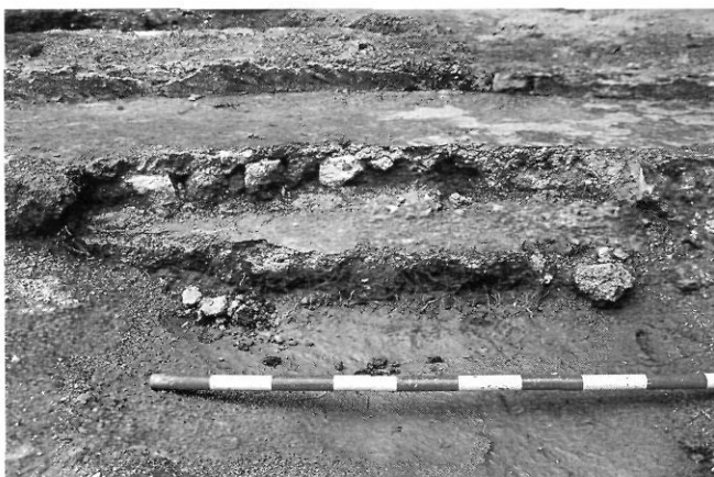
Església Vella de Rellinars. Nau interior de l'església romànica després dels treballs de neteja. A primer terme l'absis, i al fons el paviment de pedres i la porta tapiada. Foto dels autors, octubre de 1994.

La lectura del parament sud exterior de l'edificació ens ha permès diferenciar tres moments constructius: l'absis i transsepte, la nau i una ampliació d'aquesta a l'oest, d'època posterior.