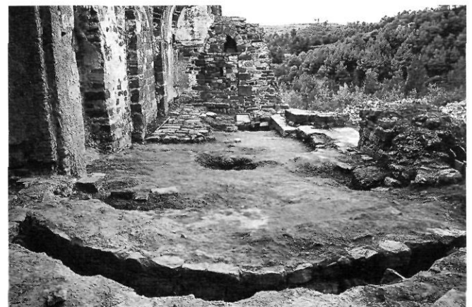
Detall de l'absis i de la doble pavimentació en opus signinum .

La façana oest es presenta parcialment conservada en alçat; s'hi observa la porta acabada amb arc de mig punt i que podria correspondre a l'accés original. El paviment de pedres, descrit anteriorment, ve a morir a aquesta porta; es tracta de dues construccions contemporànies. Aquesta porta va ser tapiada i inutilitzada en un moment posterior.