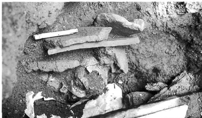
Enterrament núm. 13. Excavació 1980-81. Museu de Terrassa. (Foto: A. Moro).

Solament es disposa d'algunes peces dentàries soltes del maxil·lar superior (2 peces) i de la mandíbula. La característica més important és la presència d'hipoplàsia, que correspon a diferents etapes de la formació de l'esmalt. El desgast és moderat i no s'hi aprecia cap tret destacable. El dibuix de la cara oclusal de les molars és visible solament a M_2 (+4) i a M_3 (X4).