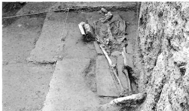
Enterrament núm. 16. Excavació 1980-81. Museu de Terrassa.