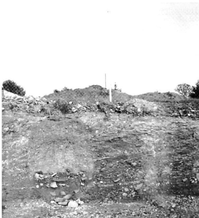
Can Ballarà. Localització de la sitja d'enterrament en el tall est de la finca.