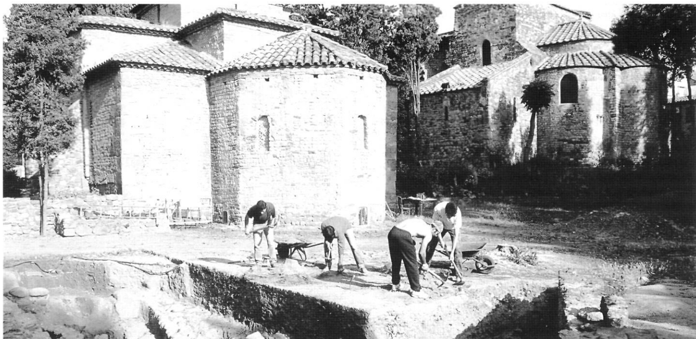
Excavació de les Esglésies de Sant Pere. Vista del desenvolupament dels treballs arqueològics (Foto excavació 1995).