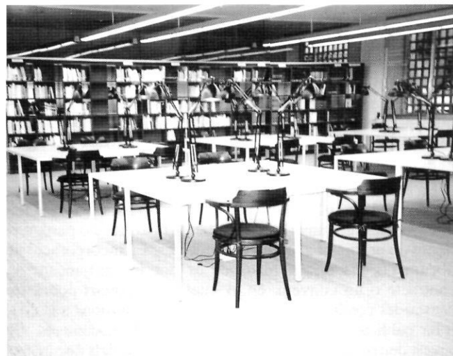
Sala de consulta.

Realització d'estudis per a tesis o treballs universitaris. Investigacions necessàries per a la realització d'estudis històrics. L'usuari haurà de disposar de la targeta d'investigador, que pot obtenir el mateix Arxiu. Qualsevol recerca haurà d'anar precedida de la consulta de les fonts publicades eventualment existents sobre el tema requerit. La consulta de documents antics microfilmats s'haurà de fer, preventivament, mitjançant les microformes disponi-