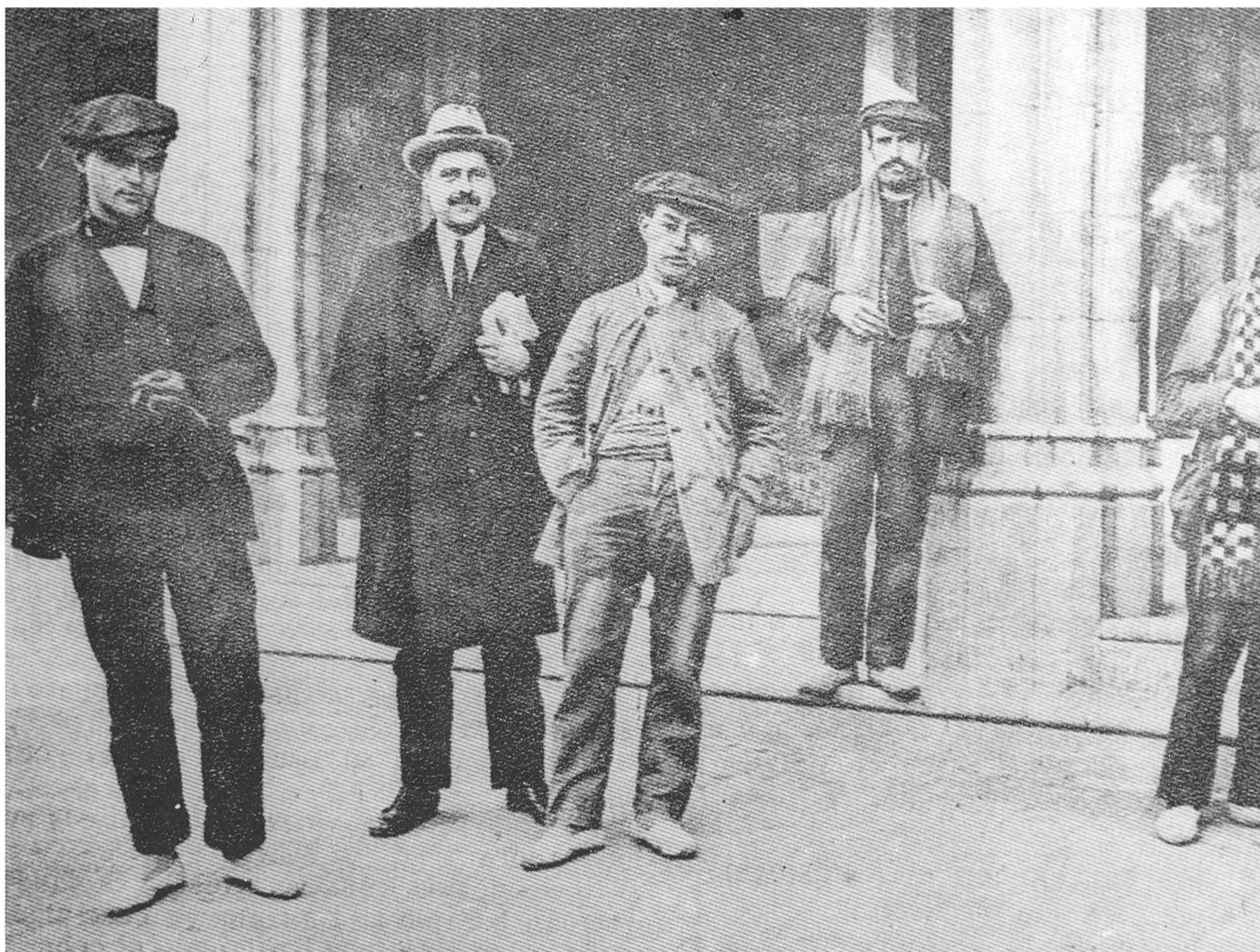
El sindicalisme radical i reivindicatiu comportà un obrerisme més desafiant. Entre l'altra fotografia i aquesta han passat només 17 anys.

por parte del Estado, organismo a quien corresponde en último término la función reguladora del mercado del trabajo; y considerando que la extensión de la actual situación económica difícil, debida a la restricción del crédito y a la crisis bancaria, ha hecho del fenómeno "paro forzoso" un problema general y no local, lo que obliga a que cualquier medida de atenuación que se tome, sea adoptada con carácter de generalidad y traducida en ley ineludible, a fin de evitar que los costos de la producción dentro de una misma rama industrial puedan quedar afectados en proporción diferente por los elementos constitutivos de la "contribución legal" 33 ... Cree, además, la "Mutua Fabril", que en estos momentos de transtorno y de ruína, la verdadera contribución de los industriales al seguro contra el paro forzoso, no es ni puede ser otra que el mantener las fábricas en actividad hasta el último momento; y que si no se ha tenido previsión de constituir un fondo de reserva colectivo, que por otra parte acaso tampoco hubiera bastado para subvenir a las necesidades actuales, todos los signos son, en cambio, de que los salarios elevados en estos últimos años, han permitido la formación de reservas individuales, a las que corresponde ahora entrar en funciones. Estas son, señor Presidente y señores Vocales de la Junta Local de R.S., las conclusiones que después