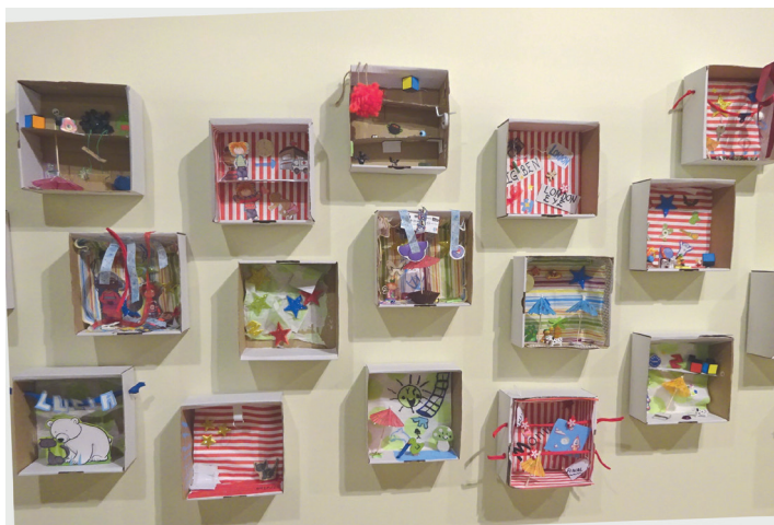
Capses de records personals elaborades pels infants participants en els tallers d'estiu del Museu.

Del 7 de febrer al 7 de març es programarà el cicle de conferències "Memòria del col·leccionisme artístic terrassenc en el que diversos especialistes analitzaran col·leccionistes i col·leccions locals.