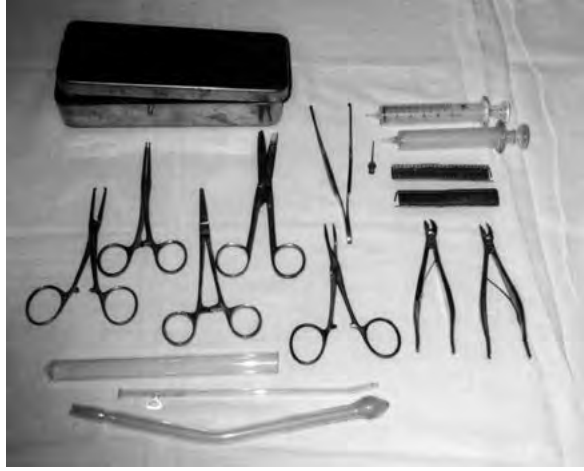
Instrumental emprat per les llevadores (Rosa M. Masana)