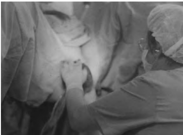
Part en un hospital

A partir de la dècada dels anys setanta va ser quan les llevadores van passar d'atendre les parteres al llit de casa a atendre-les a la llitera ginecològica de les clíniques i hospitals.