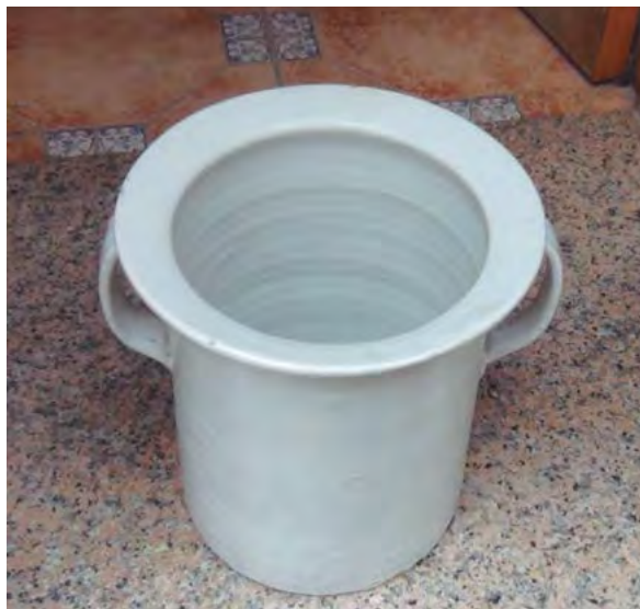
Un tipus d'orinal anomenat "perico" 7

Madrona Rosell o Tusell. Va viure al carrer de la Font Vella i també al de Cantaré, número 9. Consta que l'any 1890 pagava impostos i l'hem vist a dos domicilis: al carrer Cantaré, 9 i Porta Nova, 14.