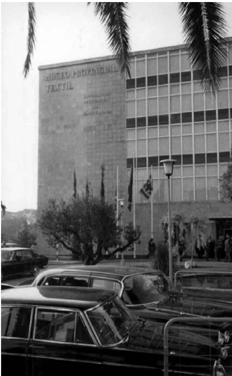
Nova seu del Museo Provincial Textil al carrer Salmeron. 1971

número que els corresponia i ara, davant del dubte, consten com a "fons antic" ja que són similars a les de la col·lecció Tolosa. Tot i així, gràcies un cop més a les fotografies, en aquest cas dels catàlegs de la Sala Parés i Galeria del Cisne 34 , hem pogut localitzar-ne algunes. Cal tenir en compte, a més, que alguns números de registre poden correspondre a dues o més peces, com un conjunt de jupa i casaca. Això fa que el nombre de peces en realitat augmenti, i que el total sigui superior al dels números registrats. Excepte sis números donats de nou, la resta mantenen la numeració que els correspon segons el llibre de registre.