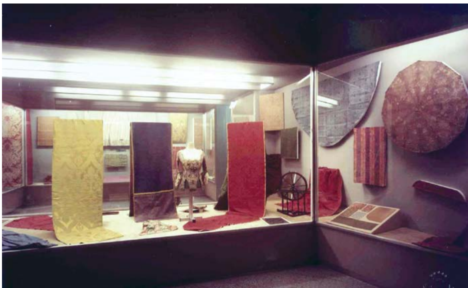
Sala de teixits al carrer Salmeron. 1971

No és, com ja hem dit, fins pràcticament l'any 1987 que es va iniciar el registre i inventari sistemàtic de les col·leccions del CDMT. Tot i així, any rere any, col·lecció