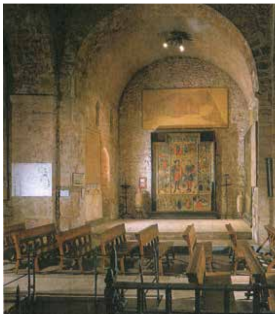
Fig 6. Interior de l'església de Santa Maria. Extreta del llibre CASTELLANO, Anna. VILAMALA, Imma; Les restauracions de les esglésies... Pàg. 35.

A partir de l'exposició del 1949 trobem força referències bibliogràfiques que ens indiquen que el retaule segueix a Santa Maria. Entre aquestes trobem l'article de Yarza dedicat al retaule analitzat per a la revista Terme on comenta: "[...] el retaule dels Sants Abdó i Senén,