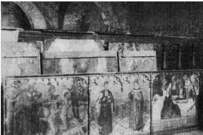
Fig 5. Fotografia de la predel·la dels sants Cosme i Damià al rerecor de l'església de Santa Maria. Arxiu Fotogràfic del Centre Excursionista de Catalunya. núm. 1369 Caixa B.

El fet que Ragon ens parli de "retablos" fa pensar altra vegada en la separació de la predel·la i el retaule central, tal com observem a la imatge de l'Arxiu Foto-