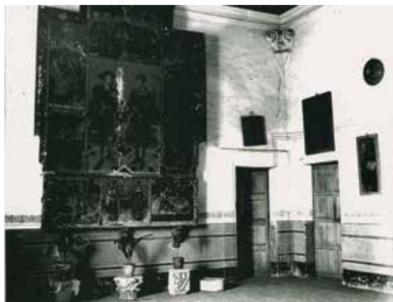
Fig 4. Fotografia del retaule de Jaume Huguet a la rectoria. Autor: Antoni Gallardo. Arxiu Fotogràfic del Museu de Terrassa.

Si contrastem les imatges veurem que l'estada al priorat ha de ser necessàriament anterior o paral·lela al moment en el qual es realitza la restauració del retaule.