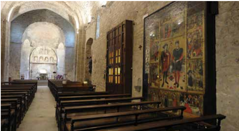
Fig 7. Fotografia de la situació del retaule a la paret sud de l'església de Sant Pere.

En l'actualitat, degut a les obres de restauració de l'església de Sant Pere produïdes entre el març del 2013 i el març del 2014 el retaule ha estat retirat i s'ha transportat al Centre de Restauració de Béns Mobles de Catalunya on s'ha restaurat la peça, que tenia zones on la pintura s'havia aixecat i s'ha col·locat sobre un nou suport metàl·lic. La direcció del Museu ha decidit col·locar la peça en la mateixa ubicació on havia estat anteriorment a l'església de Santa Maria, és a dir, al mur nord del transepte nord, i les raons en són una millor visibilitat i una major conservació ja que aquí es troba més allunyat del pas dels visitants, hi ha una millor climatització i ja no es necessari cobrir-lo amb una estructura de vidre que en dificultava el visionat i creava una excessiva humitat perjudicial per a l'obra. 53