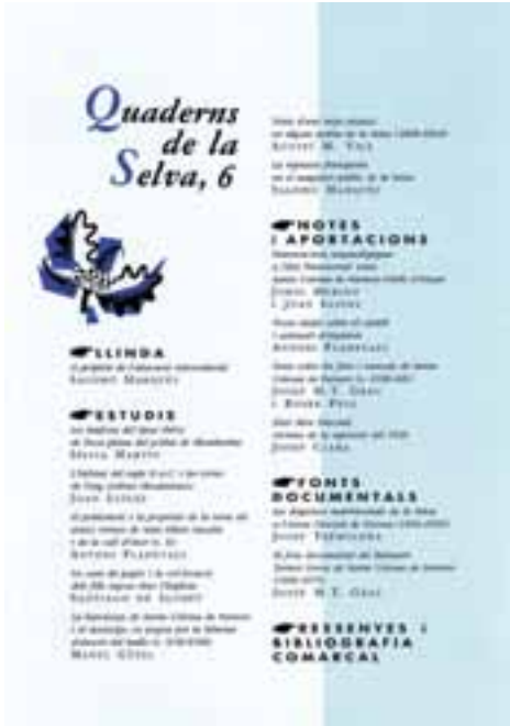
Quaderns de la Selva , revista del Centre d'Estudis Selvatans. Santa Coloma de Farners.