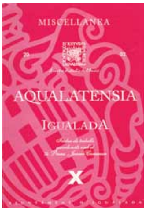
Miscellanea Aqualatensia , revista del Centre d'Estudis Comarcals d'Igualada i l'Ajuntament d'Igualada.

Nous enfocaments i presentacions per a un objectiu antic: difondre el coneixement del lloc, en les diverses disciplines implicades, a partir d'una recerca rigorosa, d'una reflexió serena que vagi més enllà d'interessos i modes, que cada vegada més caldria difondre amb una presentació acurada i una prosa amena i entenedora. Al capdavant de tot, hi hem de buscar i trobar l'enriquiment de la bibliografia del lloc i la general, i una funció social impagable, feta amb moltíssims menys recursos que d'altres coses de consistència dubtosa proclamades profusament a toc de timbal i plateret.