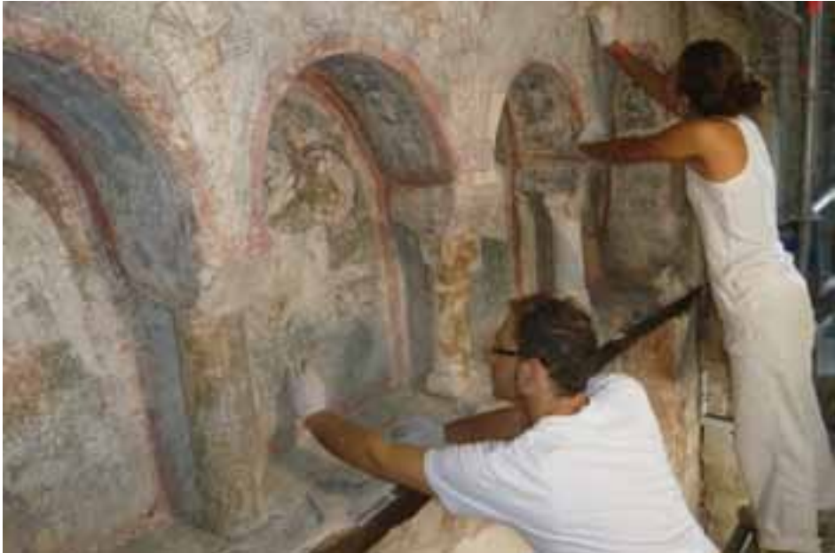
Figura 1. Treballs de restauració del retaule petri de Sant Pere.

concrets dels nostres jaciments, sobretot el material procedent de les excavacions de les esglésies de Sant Pere: epigrafia ibèrica, àmfores romanes, arquitectura cristiana, etc. Però també s'ha de fer esment de l'interès per estudiar aquells materials que són a d'altres poblacions i que procedeixen d'intervencions antigues, del segle XIX, com ara les sitges de can Bosc de Basea o els materials de can Missert. És per això que volem incloure aquí una petita aportació d'aquests estudis monogràfics redactats pels propis investigadors que, malgrat que siguin una mínima aportació de dades, els considerem importants per al nostre coneixement local. A tots ells, gràcies. En Jordi Pérez té l'honor d'engegar aquesta aportació puntual amb un estudi novell com és la presència, fins ara desconeguda, a can Missert d'una tomba d'època Neolítica, de la Cultura dels Sepulcres de Fossa, amb una datació entorn del tercer mil·lenni.