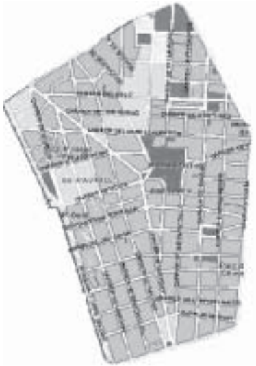
Fig. 2. Mapa del barri de Ca n'Aurell, delimitat per l'avinguda d'Àngel Sallent, la Rambla d'Ègara, el passeig del 22 de Juliol i les carreteres de Montcada i de Martorell.