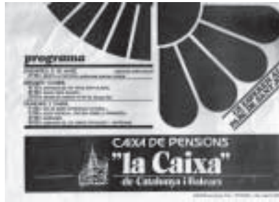
Fig. 5. Cartell de la Festa de la Primavera de l'any 1978.

sembla s'havia de redactar un projecte per presentar a l'Ajuntament, tot i que el ple municipal de 6 de maig del 1977 va aprovar un pressupost de 25 milions per a l'ampliació i millora del parc, 23 i atendre les queixes de diversos veïns sobre alguns temes: “El pas del carrer Beethoven, l'escola de Can Niquet, senyalitzacions de trànsit, sanitat, els porcs del Munill [devia ser alguna granja que hi havia al barri, que no recorden amb exactitud], les rates de la bassa del parc o els resultats d'una enquesta 24 passada als veïns sobre problemàtiques del barri.” 25