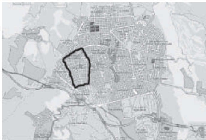
Fig. 1 Mapa actual de la ciutat de Terrassa, amb els barris que es van anar formant durant el segle XX. El barri de Ca n'Aurell hi està delimitat amb color negre.

El moviment veïnal de Ca n'Aurell, com ja s'ha esmentat, serà analitzat a partir de l'aportació de les fonts orals d'alguns dels seus protagonistes, concretament cinc