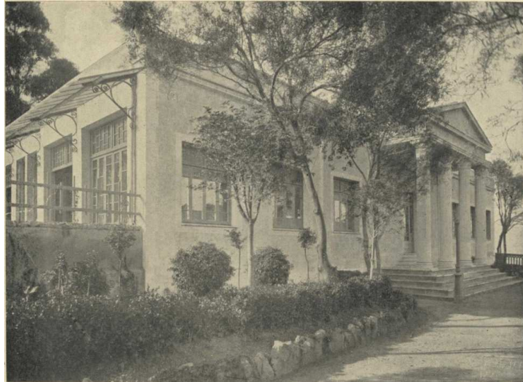
Figura 2. Escola del Bosc de Montjuïc: façana orientada a llevant del pavelló destinat a aules