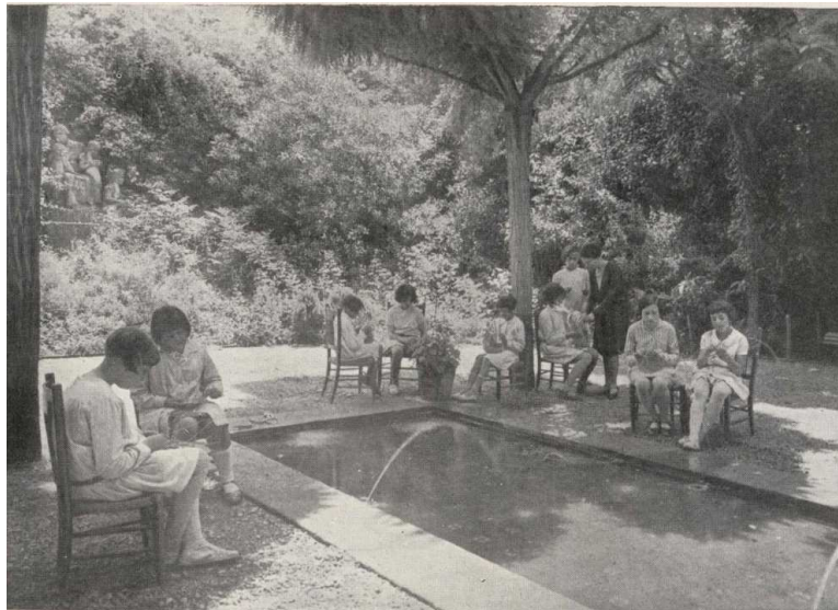
Figura 4. Escola del Bosc de Montjuïc: nenes realitzant labors de costura i tricatatge a l'aire lliure, a l'ombra de les acàcies

qüi (Sensat, 1914-1928, s.p.–23 d'octubre de 1915) i altres làmines. També empraria, per a l'art, làmines com, per exemple, la de la catedral gòtica de Colònia.