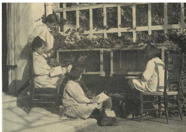
Figura 3. Escola del Bosc de Montjuïc nenes observant i dibuixant del natural a l'aire lliure