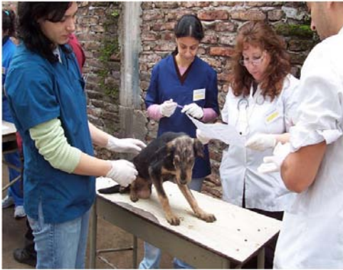
Figura 4. El Proyecto Piletones és una pràctica APS de la Facultat de Veterinària de la Universitat de Buenos Aires, adreçada a la prevenció de les malalties zoonòtiques en un dels barris més desfavorits de la ciutat.

Ara fa 14 anys, el Ministeri d'Educació, en col·laboració amb CLAYSS (Centro Latinoamericano de Aprendizaje y Servicio Solidario), va convocar per primer cop un seminari internacional sobre aprenentatge servei, que s'ha anat repetint cada any, associat fins fa poc a l'atorgament de premis «presidencials» sobre APS, al qual s'hi presenten centres educatius de tots els nivells.