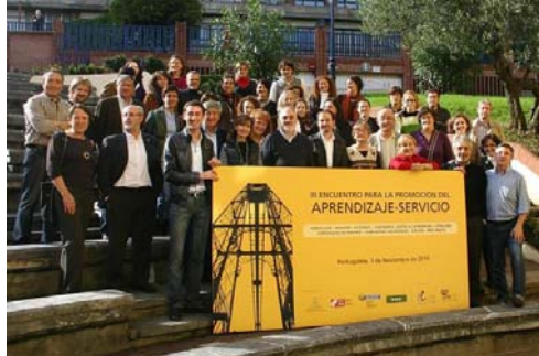
Figura 7. Constitució de la Red Española de Aprendizaje-Servicio a Portugalete, País Basc, el novembre de 2010

La definició d'aprenentatge servei que s'està difonent a Espanya és l'elaborada pel Centre Promotor Aprenentatge Servei: «És una proposta educativa que combina processos d'aprenentatge i de servei a la comunitat en un sol projecte ben articulat en el qual els participants es formen tot treballant sobre necessitats reals de l'entorn amb la finalitat de millorar-lo».