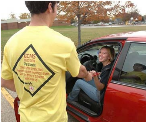
Figura 3. Project Ignition és una pràctica APS, impulsada per NYLC, per a la prevenció dels accidents de trànsit dels adolescents.

Es calcula que un 24% de les escoles de primària i secundària, és a dir, 20.400 centres educatius, apliquen aprenentatge servei, implicant 4,2 milions d'estudiants. D'altra banda, 1.198 universitats i centres d'educació superior en general —dels 5.750 que hi ha als EUA— estan associats a Campus Compact 4 , una xarxa que aplega les institucions compromeses amb el compromís cívic, l'aprenentatge servei, i el voluntariat.