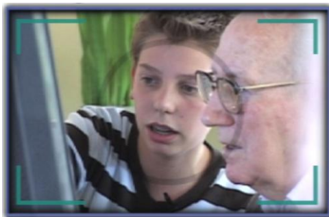
Figura 6. Ensenyar informàtica a la gent gran és una de les pràctiques més habituals del civic intership holandès.

Per dirigir aquest procés es va constituir un equip coordinador a nivell nacional, amb dues institucions per al desenvolupament social encarregades, cadascuna, d'un sector diferent: CPS va liderar el procés amb el sector educatiu i MOVISIE el va liderar amb el sector de les organitzacions socials proveïdores de les activitats de servei.