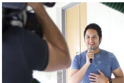
Figura 2. Producció audiovisual para ONG's és una pràctica APS a la Facultad de Ciencias de la Información y la Comunicación del Tec de Monterrey