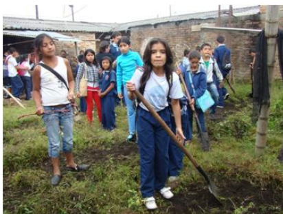
Figura 5. El Proyecto Agricultura urbana és una pràctica APS de l'escola Los Comuneros, de Popayán, que consisteix en la recuperació i difusió de la tradició agrícola i l'alimentació saludable entre la població.

No hi ha control específic per part de les administracions acadèmiques. En la mesura en què per llei el SSOE forma part del projecte educatiu del centre, quan hi ha una inspecció, aquesta també supervisa com està funcionant el SSOE.