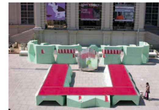
▼ PPAG architects ztgmbh. Museumsquartier, Vienna, 2005-09.

La planificació acurada de l'evolució de la proposta al llarg del temps està coordinada per MuseumsQuartier E+B, l'organisme encarregat de la programació cultural del centre, i per PPAG Architects, els responsables del disseny específic de cada intervenció. Junts coordinen i dissenyen el programa d'activitats i les diferents configuracions espacials que presenta el sistema modular al llarg de les intervencions planejades durant l'any. Ells controlen