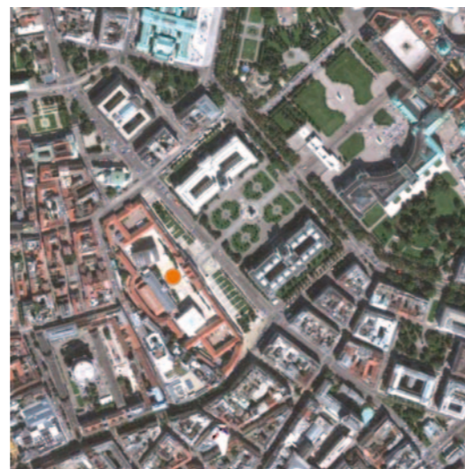
▼ Museumsquartier, Vienna