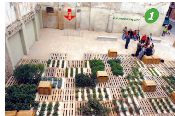
▼ gravalosdimonte arquitectos. San Blas, Saragossa, 2009.