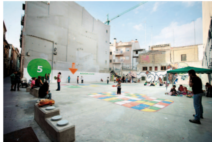
▲ gravalosdimonte arquitectos. San Agustín, Saragossa, 2009.