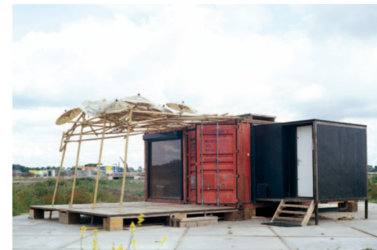
▲ Milohnic & Paschke i.s.m. Resonatorcoop. The Parasol , Leidsche Rijn, 2001-04.