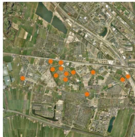
▲ Leidsche Rijn en Utrecht

Com molts altres nous desenvolupaments urbans al país, al principi el van colonitzar de seguida residents "pioners" que no tenien cap relació amb l'indret ni entre ells mateixos. En aquesta etapa les relacions socials solen ser gairebé inexistentes, i la cohesió social és molt fràgil.