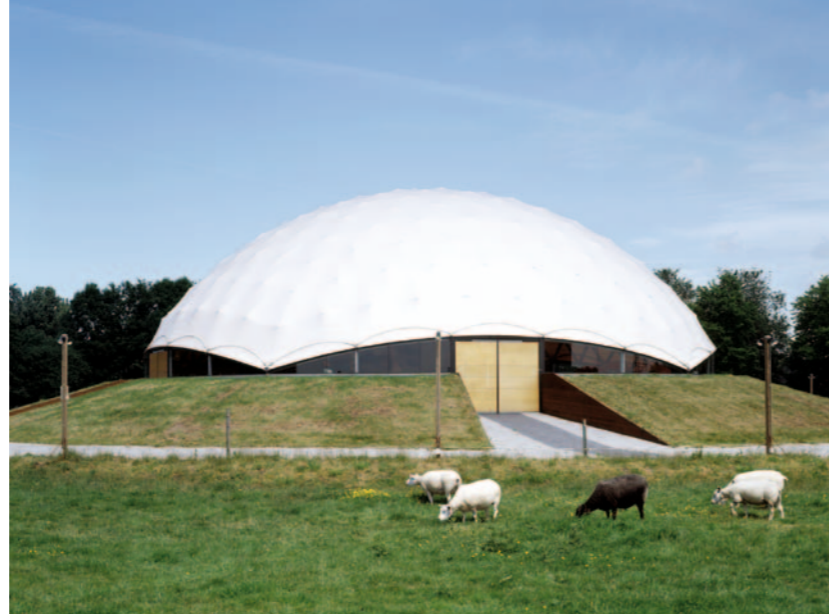
▲ Shingeru Ban. The Paper Dome , Leidsche Rijn, 2004.

paràsits en què, de vegades, els artistes convidats hi vivien i treballaven fent-hi programes d'activitats, l'objectiu dels quals era convertir els residents en actors actius de la vida urbana del barri.