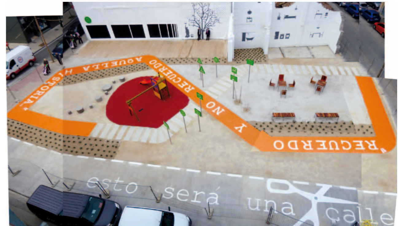
▲ gravalosdimonte arquitectos. San José, Saragossa, 2010. Foto: Patrizia di Monte, Ignacio Grávalos