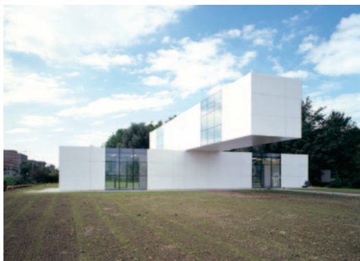
▲ Stanley Brouwn i.s.m. Bertus Mulder. Het Gebouw , Leidsche Rijn, 2005.