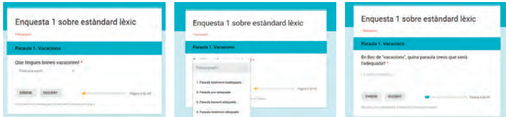
IMATGE 1 Tipus de preguntes en els qüestionaris 1 i 2

En el qüestionari 1 s'interroga sobre els mots de tots els models d'estàndard: convergent, unitari i particularista. En el qüestionari 2 hem preguntat les paraules equivalents però pròpies d'un altre model; per exemple, si a l'enquesta 1 preguntem per mentira , a l'enquesta 2 trobem mentida . Això ens ha permès contrastar la valoració dels parells de paraules, alhora que hem minimitzat la influència de la paraula donada.