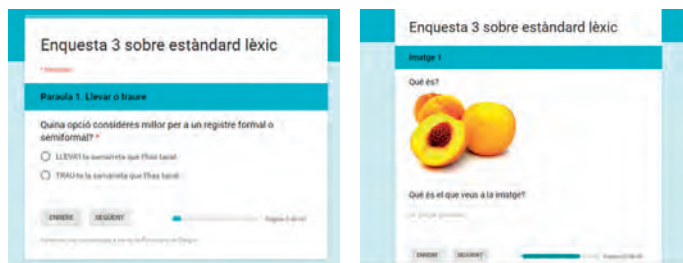
IMATGE 2 Tipus de preguntes en els qüestionaris 3 i 4, en la primera i segona parts

Hi ha alguna paraula que apareix repetida en més d'un qüestionari. Això ens ha de permetre contrastar si, amb independència de la tipologia de pregunta, el resultat sobre un mateix mot ens condueix a una conclusió equivalent.