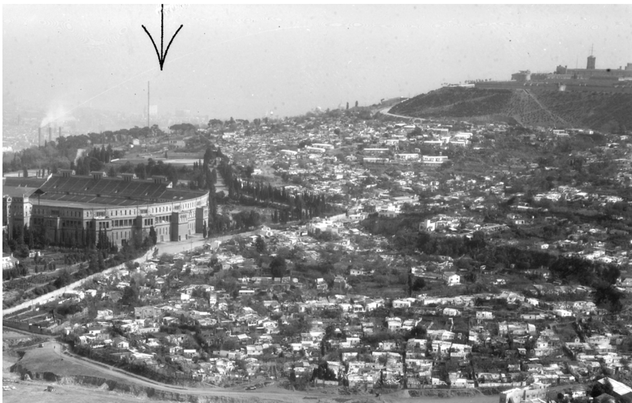
Els barris de Can Valero, les Banderes i Tres Pins de la muntanya de Montjuïc. Barcelona, anys seixanta.

poder accedir a pisos a polígons de Cerdanyola (Canaletes), i els darrers, al polígon de la Mina (Sant Adrià de Besòs), quan es va acabar el 1972. En aquesta ocasió, part dels barraquistes, amb la col·laboració d'assistents socials i advocats, van crear l'Asociación de Padres de Familia la Esperanza. La finalitat era intentar intercedir en els processos de reallotjament i adjudicació de pisos, per tal d'evitar alguna de les pràctiques expeditives amb les quals actuaven les administracions. Algunes d'aquestes pràctiques eren oferir un pis per una barraca amb placa, malgrat que hi visqués més d'una família, o tolerar la permuta de barraques entre famílies, si l'adjudicatària no disposava dels diners per a l'entrada del pis. Alhora, es va intentar donar una solució a les famílies que no podien pagar-la, que l'ajuntament simplement traslladava a altres barris de barraques o a barracons provisionals. Aquesta associació,