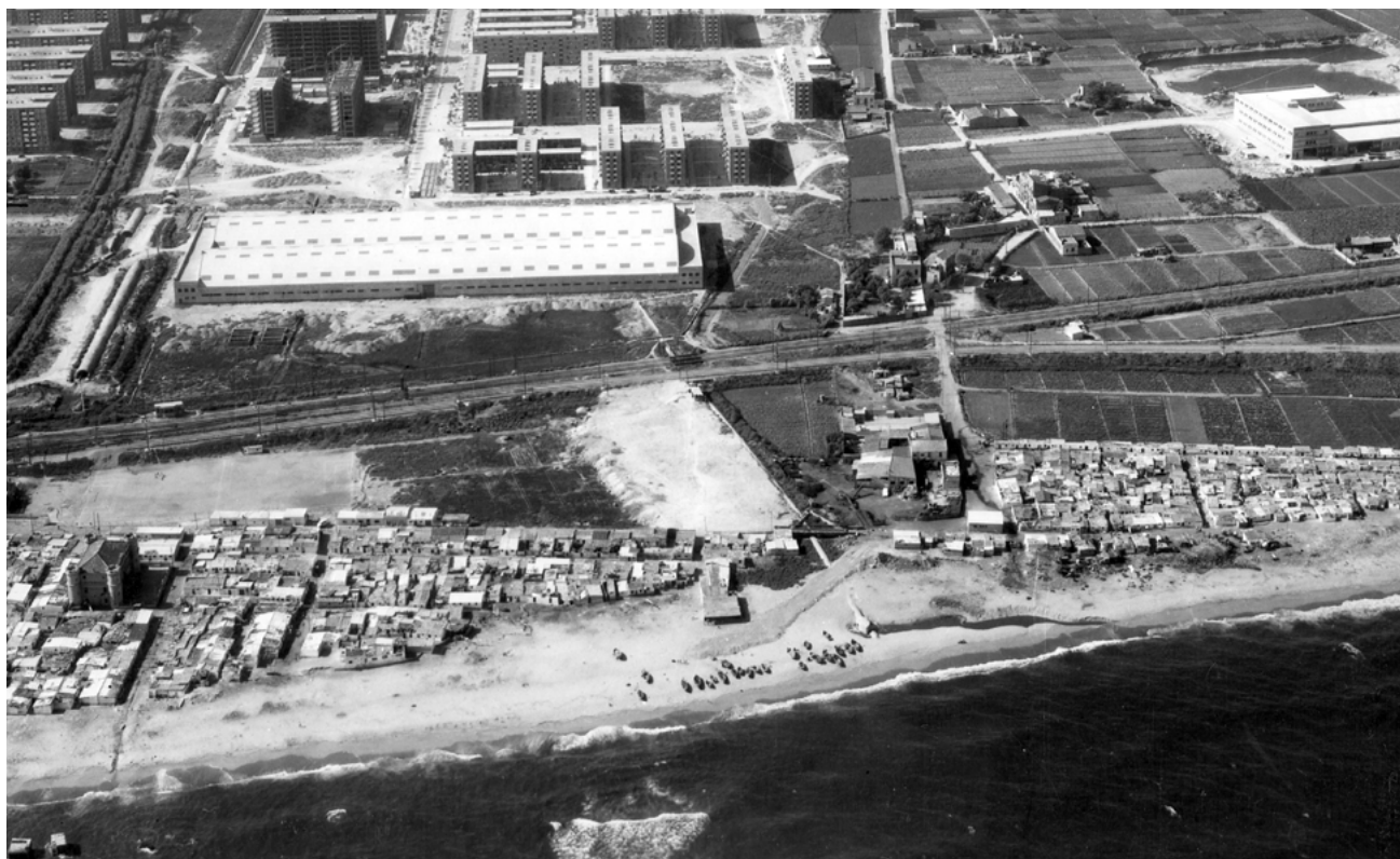
Polígon Sud-oest del Besòs (1964). En primer terme, el barri del Camp de la Bota, que paradoxalment no va ser reallotjat en aquest polígon, que va rebre els habitants del de Maricel.