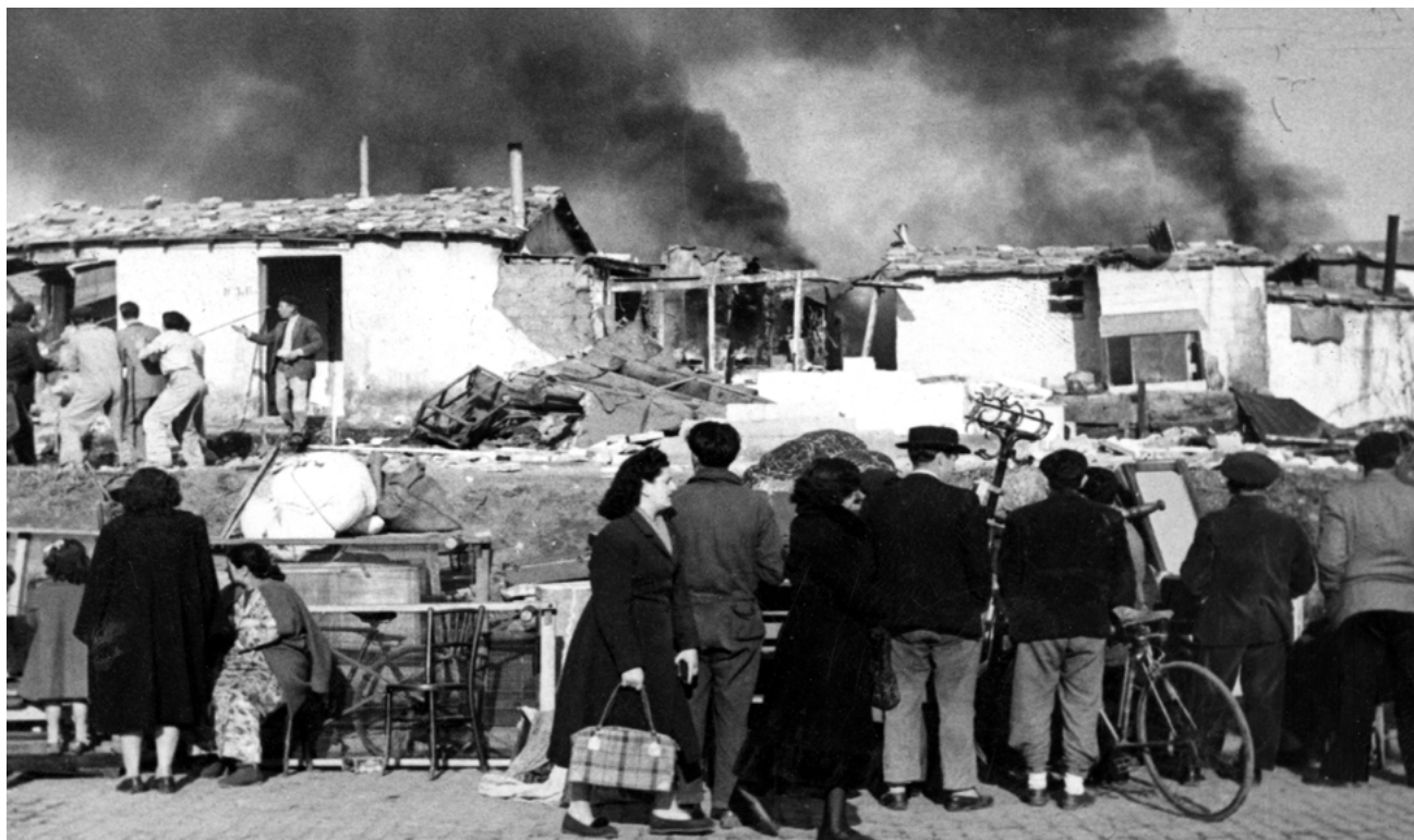
Treballadors del Servicio de Control y Represión del Barraquismo desallotgen, enderroquen i cremen un assentament de barraques. Barcelona, 1953.

hagués acabat, es va portar a terme un reallotjament a edificis creats amb aquest objectiu. Les Cases del Governador, a Verdum; el barri del Polvorí, i el barri de Can Clos, construït aquest últim a l'antiga Pedrera del Mussol de Montjuïc en només vint-i-vuit dies, van ser el destí de la majoria dels habitants de la Diagonal. Igual que les cases barates del 1929, aquests reallotjaments es van fer en edificacions amb una qualitat pèssima, lluny del centre de la ciutat, en terrenys barats i d'escassa viabilitat constructiva, i van respondre més a necessitats urbanístiques o a neteges d'imatge de la ciutat per a grans esdeveniments, que no pas a una voluntat integradora de la ciutat.