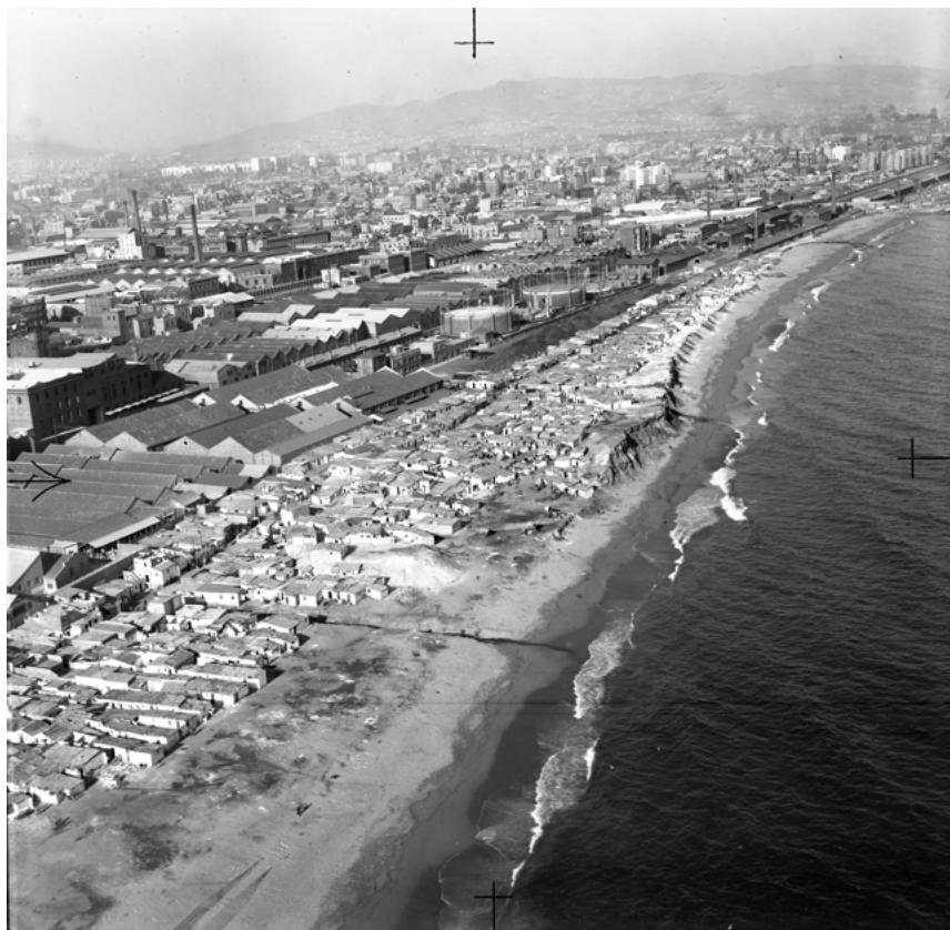
Barri del Somorrostro. Barcelona, anys seixanta.

“L’infrahabitatge més visible, les corees i el barraquisme, va adquirir una visibilització social sense precedents i va esdevenir un problema d’opinió pública per a les autoritats, i també un destorb en el planejament de la ciutat”