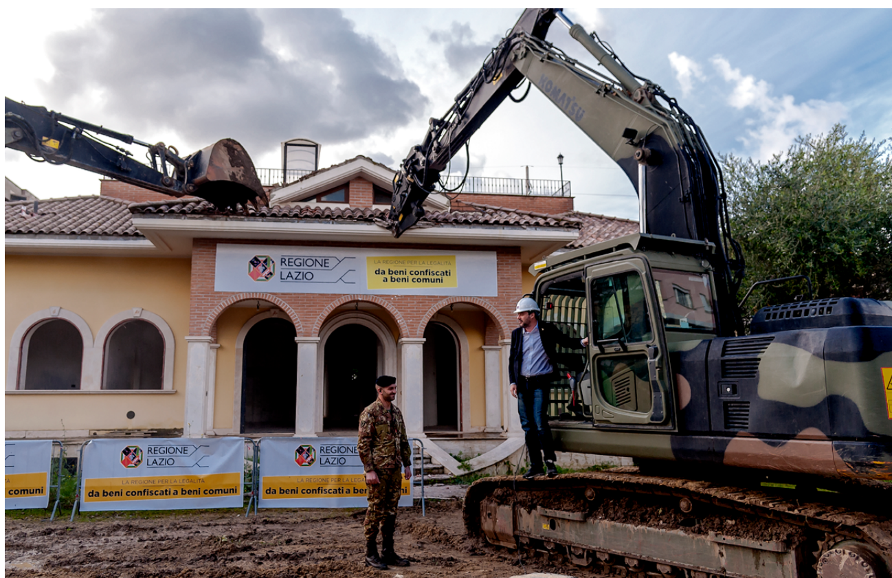
Matteo Salvini dalt d'una excavadora durant la demolició d'una vila construïda il·legalment del clan Casamonica al barri de Romanina de Roma. 26 de novembre de 2018.

van trobar a la zona on llençaven el menjar sobrant. Les van acusar de voler robar entre les escombraries i les van tancar en una gàbia plena de brossa. Ho van gravar i en el vídeo es pot veure com ells riuen mentre una de les dones crida desesperada i terroritzada dins la gàbia. El supermercat va dir que emprendria accions contra els treballadors i Salvini va reaccionar compartint el vídeo a les xarxes amb aquest missatge: “Jo em poso al costat dels treballadors (als quals oferirem suport legal) i no al de les gitanes rebuscadores. Però com crida aquesta desgraciada????!!!”. L'etiqueta que acompanyava el tuit, que va desencadenar una onada d'antigitanisme furibund, era #excavadora.