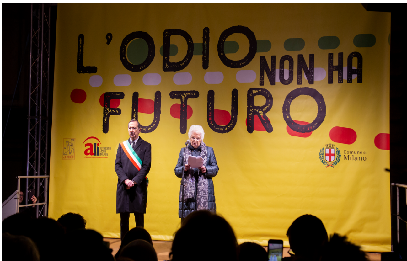
La senadora Liliana Segre llegeix el seu manifest, al costat de l'alcalde de Milà, Beppe Sala, durant l'acte "L'odi no té futur - La marxa per Liliana Segre", que va reunir milers de persones i més de 600 alcaldes de diverses ciutats d'Itàlia. Milà (Itàlia), 10 de desembre de 2019.

gitanes que van viatjar amb ella cap al camp d'extermini les van portar en massa a les cambres de gas. "Si la nostra democràcia s'embruta amb lleis especials contra romanís i sintes, m'hi oposaré amb totes les meves forces!", va dir, dirigint-se a Salvini.