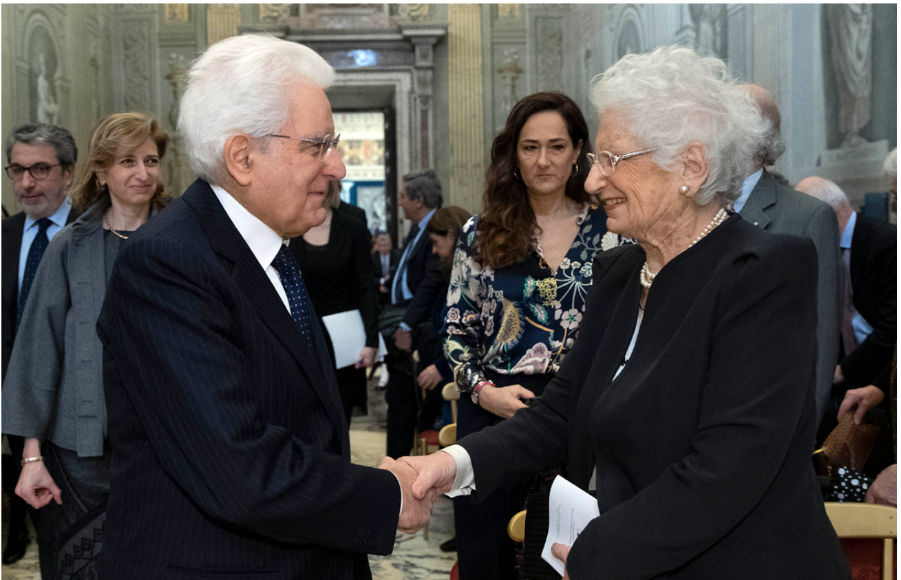
Liliana Segre, ja senadora, saluda el president de la República Italiana, Sergio Mattarella. 2019.

Des dels comptes de Salvini i des dels vinculats al seu partit, s'instigava als assetjaments contra persones gitanes. Un de molt dramàtic va ser contra dues dones grans gitanes a les quals uns treballadors del supermercat Lidl