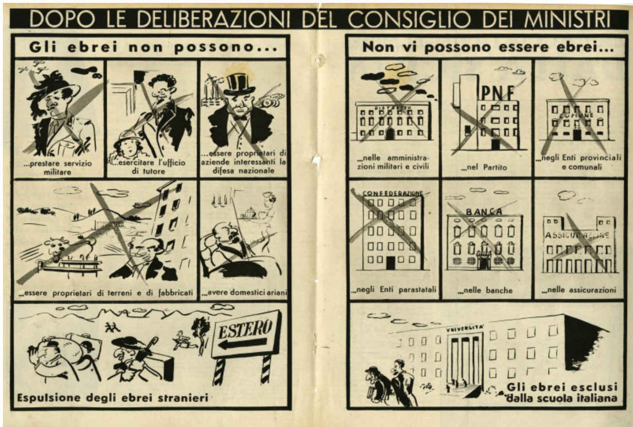
Vinyeta antisemita publicada a La difesa de la razza en ocasió de la promulgació de les lleis racials, el 1938.