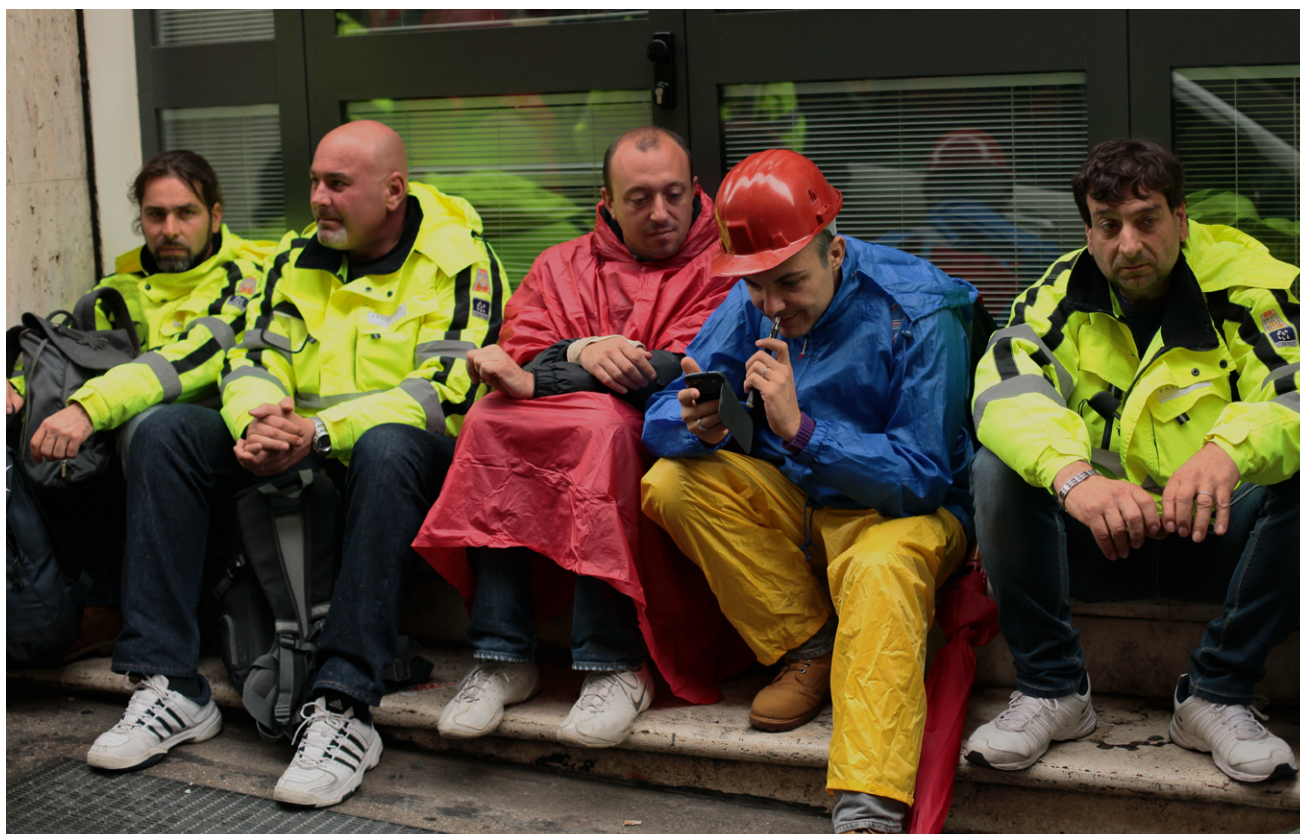
Treballadors de la planta siderúrgica de Terni durant una jornada de vaga. Roma, 6 de novembre de 2014.

La dura vaga de tres mesos contra els acomiadaments a la siderúrgica ThyssenKrupp de Terni va acabar quan 500 treballadors, un per un, van acordar renunciar “voluntàriament” al seu lloc de treball a canvi d’una bonificació d’entre 50.000 i 60.000 euros. Molts van acceptar amb dolor, però convençuts que no tenien cap altra opció. El protagonista de la novel·la de Raspi també acaba acceptant l’acomiadament voluntari a canvi de 60.000 euros. Mentre signen l’acord, ell i els seus companys “mantenen el cap cot. Aposto que senten que han traït el seu país tant com jo”, diu. Per a alguns és un alliberament de l’obsessió d’una vida a la fàbrica que cada cop té menys sentit; però per a ell, i potser per a la majoria, representa la desintegració de la identitat compartida que havia donat sentit a aquells deu anys de resistència: “La diferència entre ser un grup que marxa de manera compacta o ser una multitud en què tothom va al seu propi ritme”. Van participar