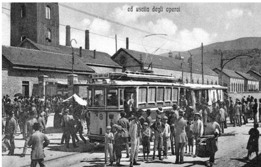
Sortida dels treballadors de la planta siderúrgica de Terni (vista parcial, sud-oest).

Aquest és el context en què els treballadors de la siderúrgica van sortir al carrer el 17 de març del 1949 per protestar contra l'adhesió d'Itàlia al Tractat de l'Atlàntic Nord i a l'OTAN. Es van dirigir en massa a una manifestació al centre de la ciutat. Però l'espectacle 'impressionant' que suposava el canvi de torn va espantar la policia, que havia format un cordó policial per evitar que s'unissin a la manifestació. Ambrogio Filippini, un antic guerriller que era a la manifestació, explica: