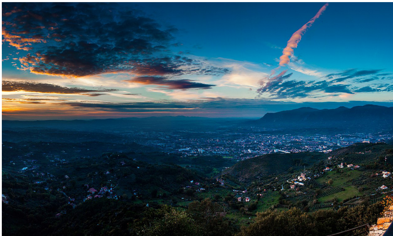
La vall de Terni vista des del castell de Miranda. Novembre del 2013.

Quan va esclatar la pandèmia i ens vam haver de tancar a casa, el febrer del 2020, jo m'acabava d'endinsar en un nou projecte: intentar entendre els motius pels quals Terni, un centre siderúrgic de la regió de l'Úmbria, a la Itàlia central, la ciutat on jo havia treballat i escrit durant mig segle 1 —i on em vaig criar—, havia passat de ser una ciutat obrera militant de color roig a un reducte electoral de l'extrema dreta en pocs anys. La pandèmia va interrompre el meu projecte, ja que era impossible recórrer els seixanta quilòmetres que separen Roma de Terni i no tenia ganes de fer entrevistes sobre temes delicats per internet. És per això que en aquestes línies reuneixo algunes de les reflexions desenvolupades en la primera fase del projecte, en la qual s'especifica la intenció de reprendre'l en els pròxims mesos.