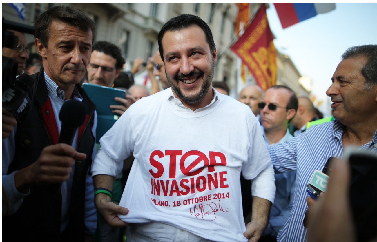
Matteo Salvini durant una manifestació d'extrema dreta en contra de la immigració. Milà, 18 d'octubre de 2014.