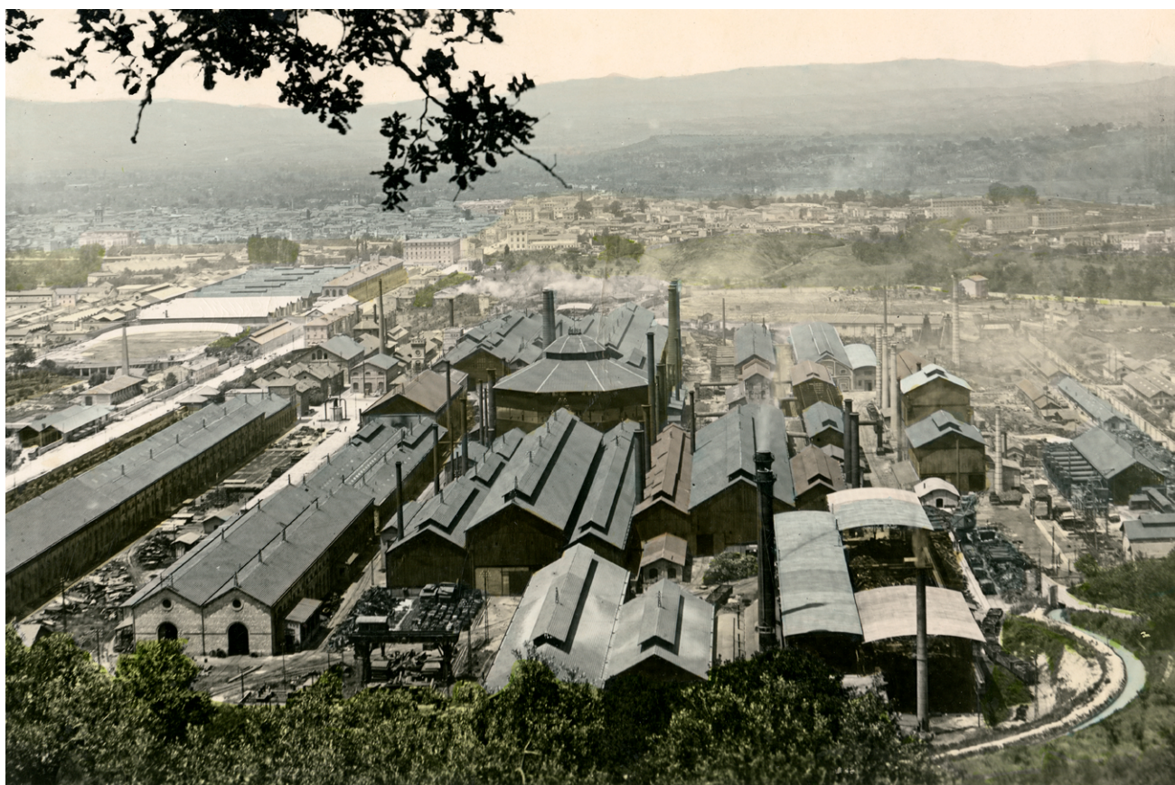
Vista de les fàbriques de la planta siderúrgica de Terni, 1910-1920.

A l'esquerra li agrada repetir que les lluites, independentment del resultat, sensibilitzen els treballadors i augmenten la consciència de classe. Però si deu anys de lluita donen lloc a la derrota, llavors la lliçó que s'ha d'aprendre és que la lluita és inútil, si no nociva. L'esquerra s'havia relacionat amb una visió de futur, un canvi, una societat diferent. Quan aquesta visió es va fer irrealitzable, l'esquerra també es va esvaïr. Per tant, per començar a concloure aquest discurs, em voldria disculpar.