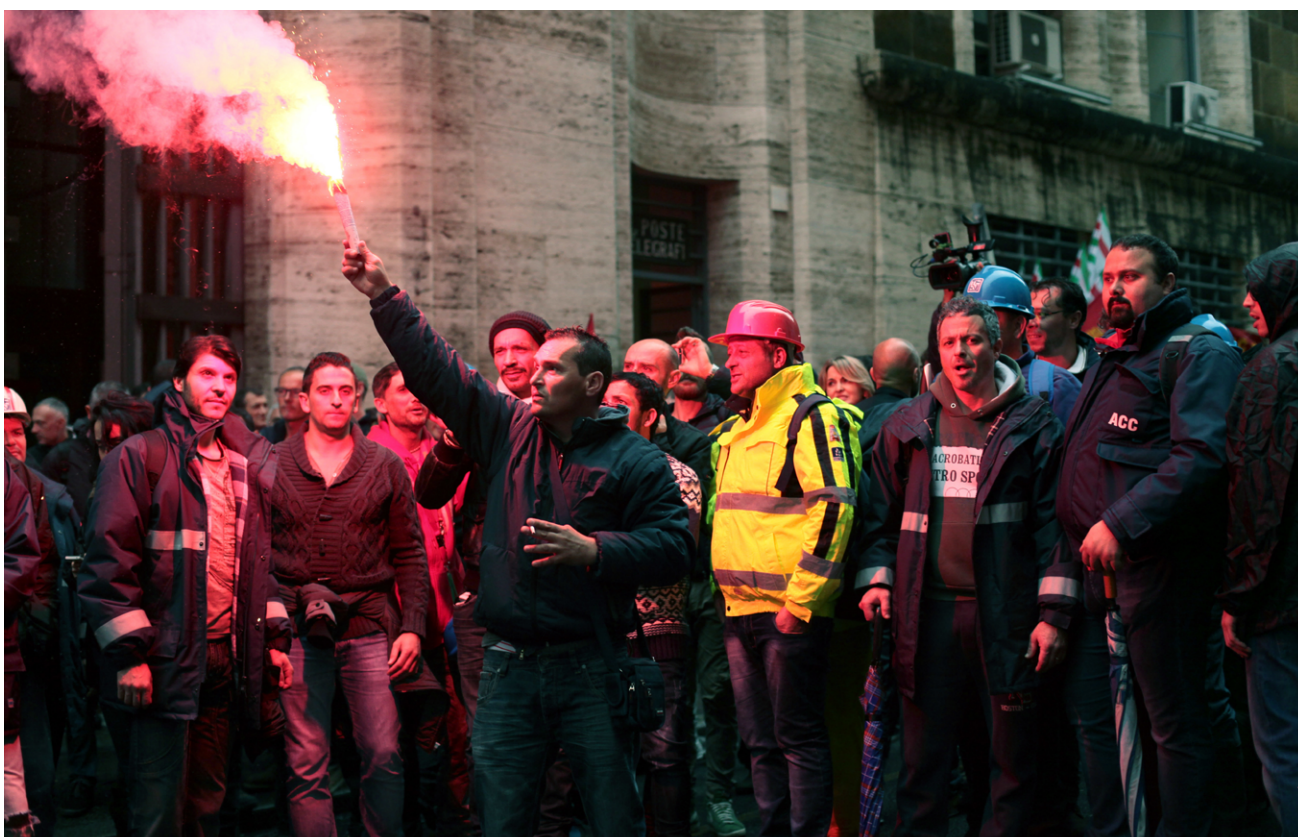
Treballadors de la planta siderúrgica de Terni en vaga protestant pels acomiadaments i per reclamar els seus pendents. Terni, 6 de novembre del 2014.

Al final, el sindicat va signar un acord que salvava allò que es podia salvar, però els treballadors ho van veure com una derrota, si no una traïció. Es van anul·lar els 400 acomiadaments, però quan l'empresa va oferir una bonificació d'unes desenes de milers d'euros a aquells que 'voluntàriament' acceptessin deixar els seus llocs de treball, més de 500 treballadors, sovint amb gran amargor, van acceptar. Va quedar palès que ja no creien en el futur de la fàbrica, en el futur industrial de la ciutat. Pocs mesos després d'aquella lluita obrera èpica, la ciutat va fer un gir massiu i traumatitzant cap a la dreta.