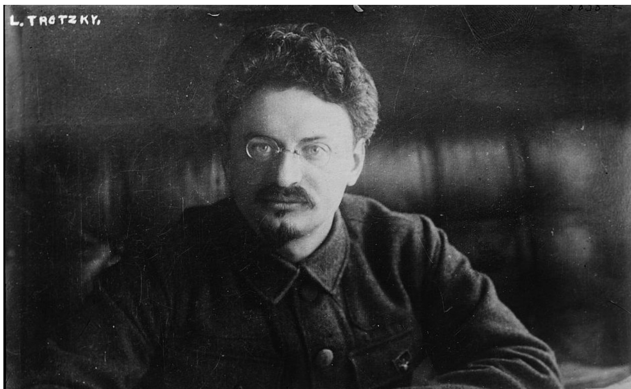
L. Trosky davant el seu escriptori

https://commons.wikimedia.org/wiki/File:Trotsky_de_frente_en_escritorio.jpg