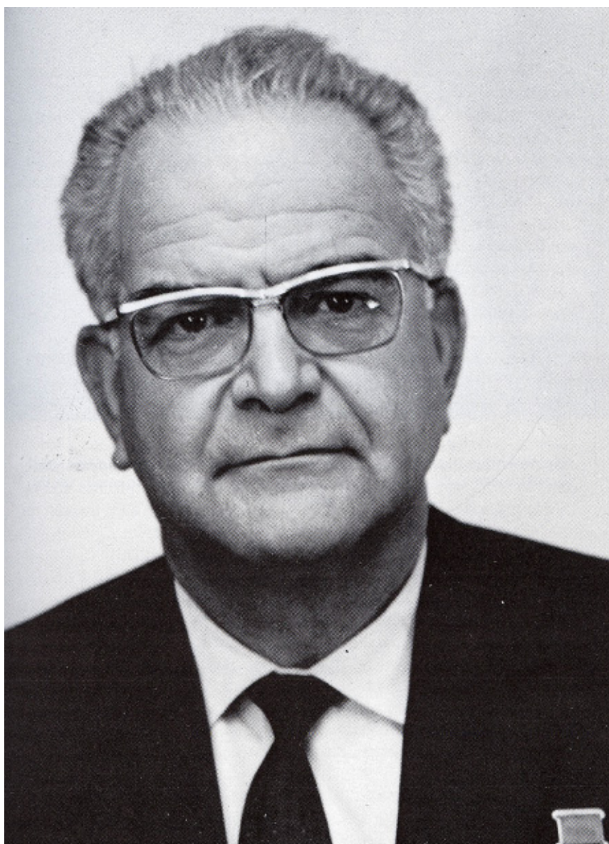
Ramón Mercader, amb l'Estrella d'Or de Heroi de la URSS

activitat clandestina fou detingut i empresonat a Sant Miquel dels Reis (País Valencià), d'on no sortiria fins a l'amnistia decretada després de la victòria del Front Popular a les eleccions de febrer de 1936. S'implicà immediatament en la preparació de les Olimpíades Populars i va ser nomenat secretari d'organització del Comitè Organitzador. I en aquesta activitat el sorprengué l'esclat de la Guerra Civil.