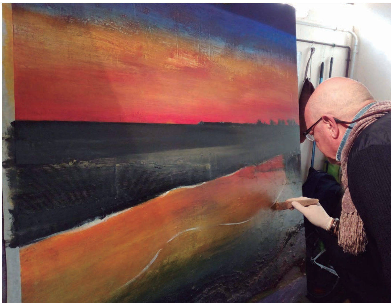
Moment de creació pictòrica de l'artista al seu estudi

obres pictòriques i escultòriques en diverses sales d'exposicions.