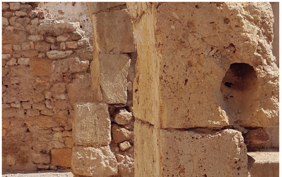
Dues ciutats, antiga i actual, conviuen a la Part Alta de Tarragona

parets de tàpia, murs del segle V, del segle VI o del XII.