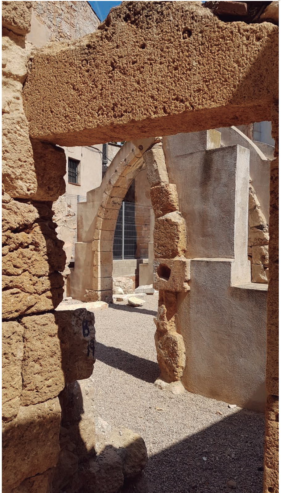
L'actuació realitzada per l'Ajuntament ha permès mantenir els arcs i l'estructura bàsica de la casa

Paral·lelament a això, hi ha un moment en que la Reial Societat Arqueològica Tarraconense, a partir d'una lectura d'un document medieval, diu