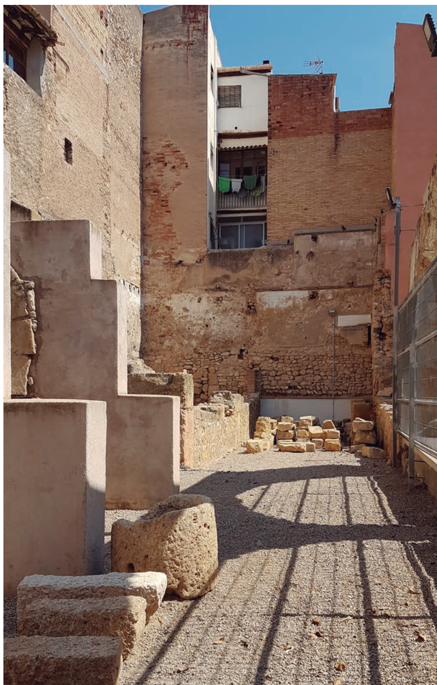
El perímetre de Ca la Garsa conviu amb els patis de les cases del carrer Santa Anna

Penseu que és bo que es promogui només el coneixement públic del patrimoni declarat per la Unesco en detriment de l'altre patrimoni de la ciutat que passa a l'oblit?