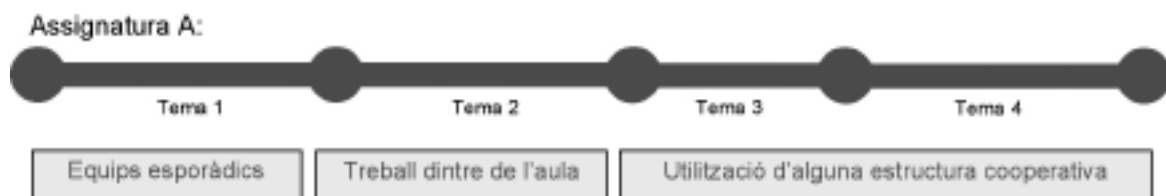
FIGURA 2. Àmbit d'intervenció B: El treball en equip com a recurs per a ensenyar

Si aquestes experiències són positives, els mateixos estudiants demanen poder treballar més sovint d'aquesta manera. Al mateix temps, aquestes petites experiències —petites, perquè es fan en sessions ocasionals i duren part d'una sessió de classe— ens serveixen per identificar els «punts febles» del treball en equip en