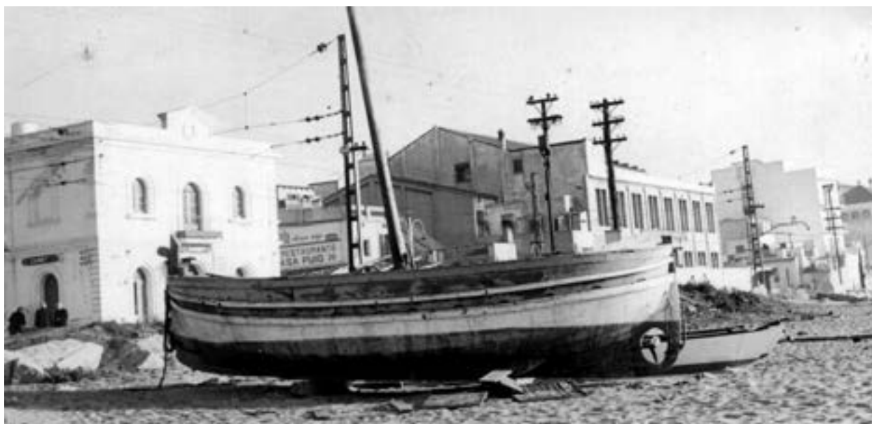
Barca Maria del Carme de can Peix, ja vella i abandonada a la platja de Canet, el pas dels anys la va anar estellant. Principis dels 60

Els pobles de la costa eren també un referent, sobretot ho eren els seus campanars: Canet, Sant Pol, Calella, Malgrat i Blanes; o bé les seves rieres: Riera d'Arenys, Riera de Canet, Riera de la Torre; així mateix també ho eren alguns edificis que sobresortien del skyline com ara les torres: Santa Florentina, Torre d'en Macià i Torre de Mar a Canet; la Torre Martina i Sant Pau a Sant Pol; així com la Torreta del Telègraf i la Farola (far) de Calella.