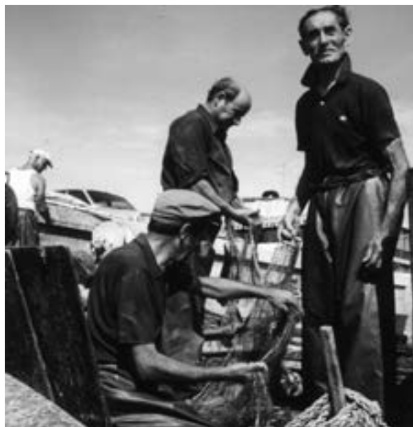
Darrera etapa. Poc abans de la jubilació als 80 anys (1986)

Tot el que us acabo de relatar ja forma part del passat, no existeix tal i com ho havien conegut els nostres pescadors. Encara avui els grans bucs de ferro amb més de 2.000 CV de potència van llaurant els fons marins a diari, aconseguint migrades captures, un fet que els obliga cada vegada anar més enfora i destruir fondalades més verges per compensar la despesa de combustible i les parts de la tripulació. Les grans confraries de pescadors, com la d'Arenys, han reduït la flota, ara molt menor que la que havien tingut anys enrere. El gran negoci de la pesca va minvant. Sortosament encara queden alguns pescadors artesans que miraculosament van fent els seus migrats jornals en el que queda dels antics roquers, pescant sempre amb respecte. La naturalesa va fent el seu curs i tal vegada d'aquí a