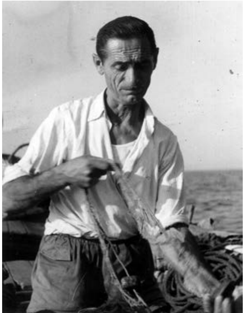
Desmallant la xarxa després d'una jornada de pesca (1960)

Des d'èpoques ancestrals l'èxit en les captures de peixos fetes amb arts de la pesca artesanal, a diferència de la d'arrossegament actual, depenia d'encertar el lloc precís on hi havia el peix; per tant no era pas l'atzar qui marcava el lloc on calia calar les xarxes, ja que de no posicionar-se correctament en el punt precís en depenia l'èxit en les captures i per tant del jornal d'aquell dia. Avui dia disposem d'una tecnologia que permet radiografiar els fons marins d'una manera fàcil i efectiva fent servir sonars i radars, enginys que detallen amb precisió la topografia del fons que s'amaga sota l'aigua. Resulta sorprenent que els antics pescadors haguessin conformat un corpus de coneixement prou precís de com era aquest relleu submarí, sense haver-lo vist mai directament amb els seus ulls. Cal precisar que el fons marí davant de la costa del Maresme és molt divers: la zona més propera a la costa la conformen sorrals i algunes praderies amb alguers de posidònia; la pesca en aquesta zona no és gaire