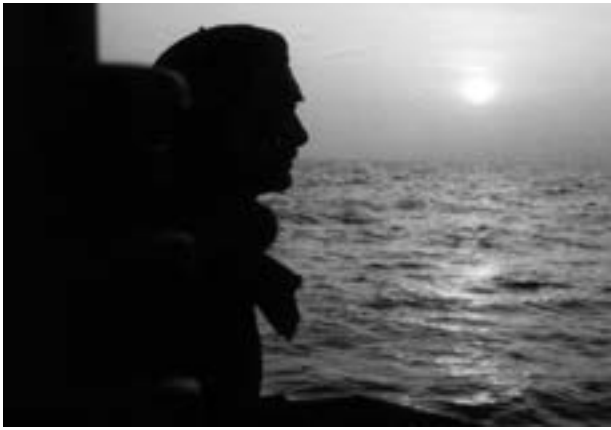
Esperant l'albada per començar a cenyir les xarxes

A Canet hi havia diversos edificis singulars o barris que eren reconeguts des del mar estant: Sant Roc, pedrera d'en Torrus, caserna dels civils, magatzem d'en Pagà, fàbrica Romagosa, fàbrica d'en Llauger, porta de l'Hospital, la Divina Pastora, «Matadero», capella del Sant Crist, can Parellada, cala Seculina, la Casa de les Rates; la Misericòrdia; etc.