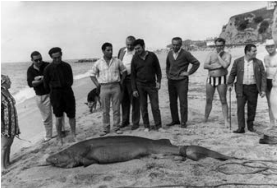
Canetencs admirant el tauró tintorera pescat davant de Canet, maig de 1969; aquest va ser el peix més gros pescat pels Isern; va quedar enganxat a les xarxes de manera accidental. Va ser portat a vendre a Barcelona però el guany no els va compensar la pèrdua de la xarxa que va destrossar.

submarina que es podia trobar mar enfora, davant la costa de Canet; ens referim al roquer que existia en el nostre mar una vegada s'havien passat els sorrals i alguers de la primera línia de costa. Un paisatge submarí que avui malauradament ja ha desaparegut ja que el fons marí es troba totalment arrasat, com exposarem més endavant. En aquest roquer hi havien feinejat des de temps immemorials els pescadors de Canet. Les famílies de pescadors com els Espàrrech, Murtra, Masriera, Tenas, Xapellí, Cabot, Isern, Ramentol, etc.