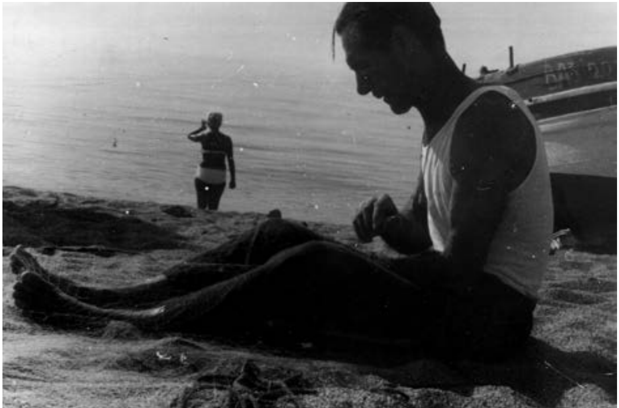
Cosint les xarxes a la platja de Canet, anys 50