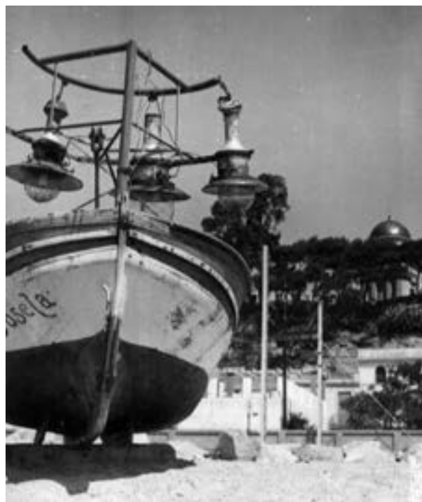
Barca Josefa de can Peix, amb llum per anar a sardinals. Jardí de can Viader al fons «la Rodalera» abans de la seva destrucció, any 1960.

Les cases de pagès del terme d'Arenys, Canet, Sant Pol i Calella també destacaven sobre el paisatge: Sant Jaume de la Murtra; la Casilla de la Murtra; can Manau; can Catà; can Figuerola; can Negre; ca