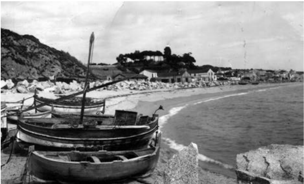
Les darreres barques de Canet arrecerades a la petita platja refugi de la Catel que ofería l'Espigó. Al fons es pot apreciar la Timba, l'horta Manent i la Rodalera encara sense edificar. Anys 50.