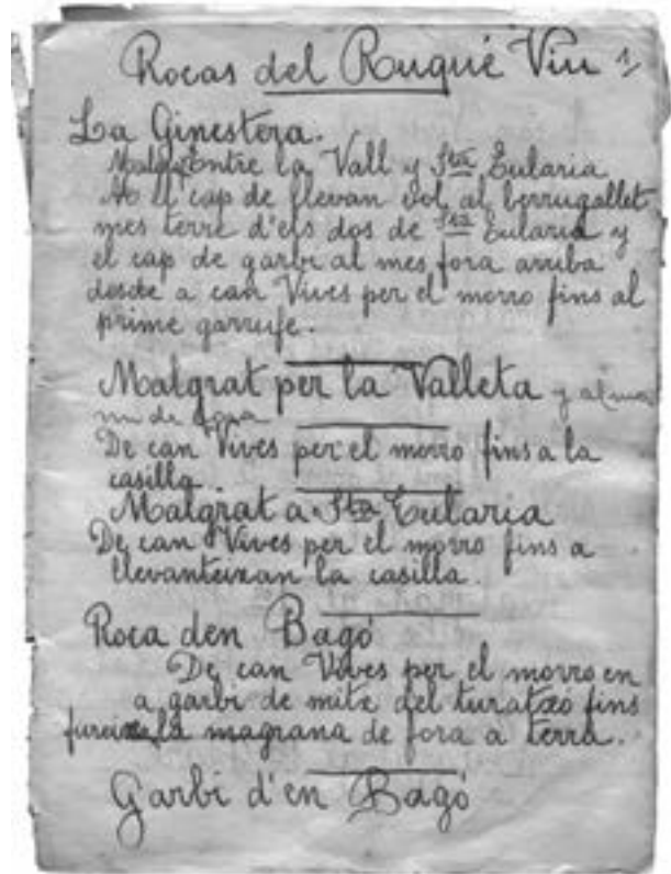
A l'esquerra, quaderns originals manuscrits on es detallen les roques de Canet. A la dreta, primera pàgina del manuscrit