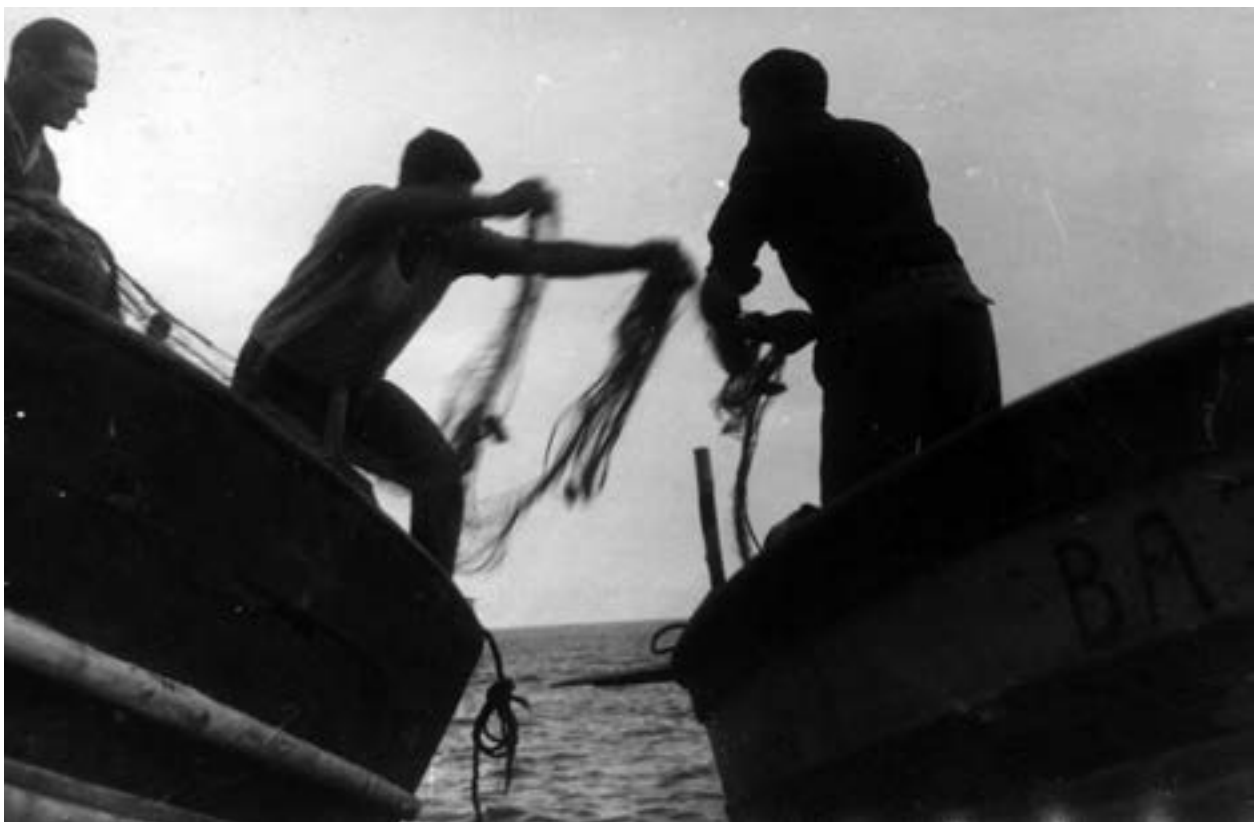
Feinejant sobre el roquer a l'albada

productiva doncs les espècies que hi habiten no són massa apreciades en el mercat, tret d'algunes excepcions. Superada aquesta franja el fons marí esdevé un paisatge molt més irregular: roquissars, barres, cims, fondalades, rieres, etc., talment com trobaríem en el relleu que tenim en terra; aquesta configuració irregular resulta ser un hàbitat idoni