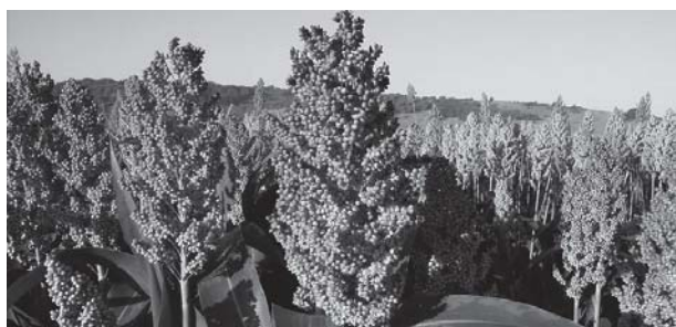
Flor de mill, Armadiillidium vulgare

Només recordo que per començar hom deia que