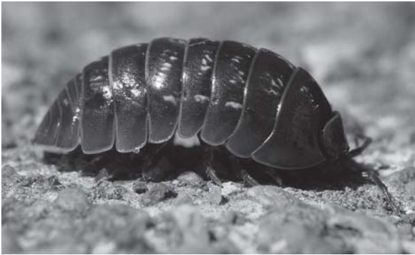
Porquet de Sant Antoni, Armadillidium vulgare

de foc apagada una gota d'oli amb el setrill, va agafar-me per la cintura com si fos una garba de blat i em va abocar de cara a la caldera. L'inesperat del fet va fer segurament que m'hi sotmetés estúpidament sense regirar-me. Segons la perceptiva guaridora d'aquella gent, si hagués estat 'enyorat', la gota d'oli s'hauria disgregat a sobre l'aigua de la caldera però, com que en el meu cas devia mantenir l'enteresa compacte, hom va deduir que no estava 'enyorat'. Potser allò va ser tot o en tot cas no en recordo res més. Del que sí en tinc memòria és que es tractava d'una dona revellida que d'entrada em va fer mitja por; vivia en una casa mig desballestada. Sort que la gota d'oli va mantenir la cohesió, perquè del contrari, si s'hagués disgregat, la cosa hauria entrat en el terreny de la terapèutica i no sé si no hauria hagut d'assumir el remei que era fer-te empassar una picada de porquets de sant Antoni. Sí, sí, parlo d'aquells insectes de color gris que es fan als femers i sota els testos de les plantes i flors que, si els toques, es cabdellen sobre si mateixos convertint-se en minúscules boletes, com porcs espins en miniatura. Sospito que la denominació de 'porquets' deu venir d'això. Només de pensar que em podien haver fet empassar aquella immundícia, encara em venen ganes de perbocar. I no n'hi havia prou amb una sola vegada, sinó que com de gairebé tots els remeis de la tradició popular, calia fer-ne una novena seguida i completa.