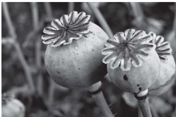
Cascall, Papaver somniferum

tendre, o sigui, el suc blanc que surt de les garrofes quan encara son verdes. Els farmacèutics cremaven les berrugues amb sulfat de plata.