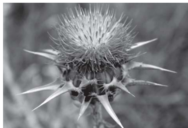
Card marià, Silybum marianum

Per les berrugues: calia aplicar-s'hi llet de garrofina