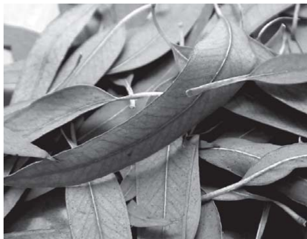
Fulles d'eucaliptus, Eucalyptus camaldulensis

Pel reuma: Fregues d'allis crus i ortigues de les més