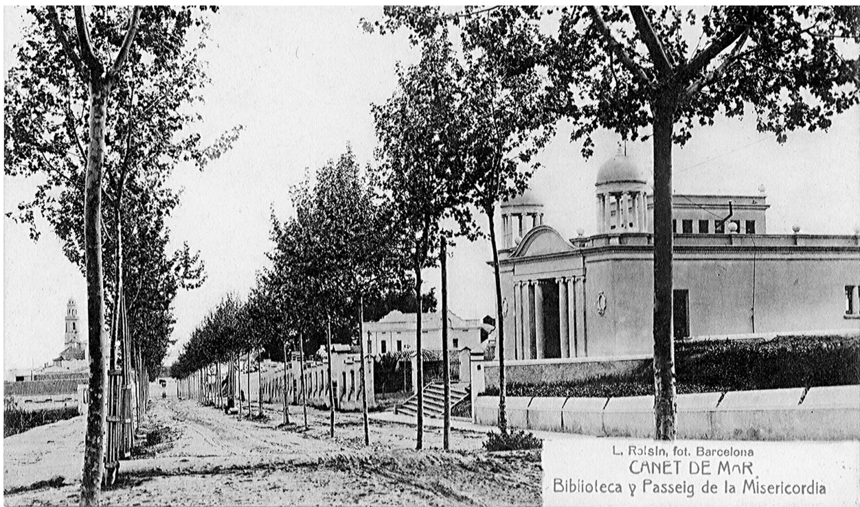
L'edifici «clàssic» d'estil noucentista de la Biblioteca P. Gual i Pujadas (1919) poc després de ser construït.

l'arquitectura. Tot admirant igualment les excel·lents cases modernistes locals, s'alegraren de les principals obres arquitectòniques que s'aixecaren a Canet seguint els nous models noucentistes: en primer lloc l'edifici de l'antiga biblioteca (actual Escola de Música ) al Passeig de la Mare de Déu de la Misericòrdia, inaugurada el 1919, executada per un dels màxims representants del noucentisme català, l'arquitecte Lluís Planas Calvet, 7 i tot seguit l'edifici social i botiga de la cooperativa La Canetenca (actual edifici restaurat de l'Odeon, situat darrera l'església parroquial), les obres del qual foren projectades i dirigides a partir de 1920 pel més destacat promotor i màxim exponent de l'arquitectura noucentista: el gironí Rafael Masó Valentí (1880-1935). 8 Tots tres poetes coincidiren amb aquest arquitecte en certes activitats culturals des d'inicis de segle i s'amistaren amb ell.