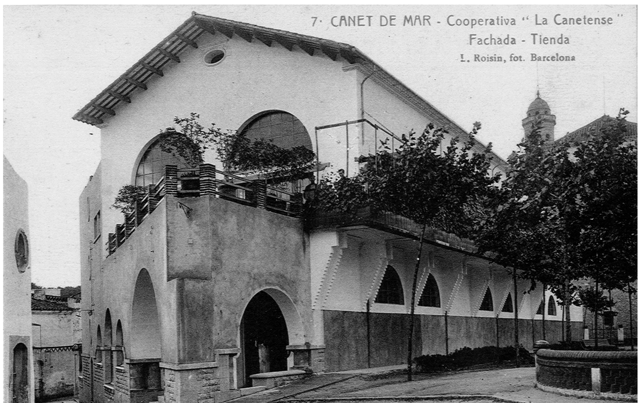
L'edifici noucentista de la cooperativa La Canetenca (1920-1925), obra de l'arquitecte Rafael Masó.