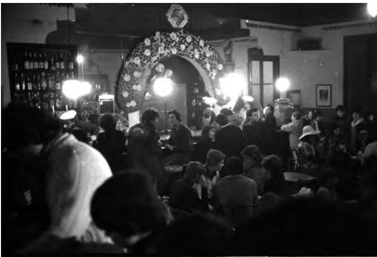
Activitat festiva al cafè Odèon.