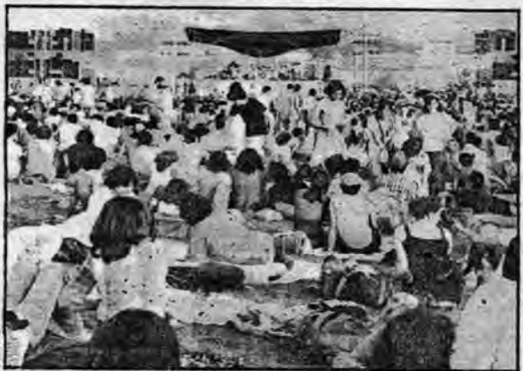
Canet: el que podria haver estat i no fou