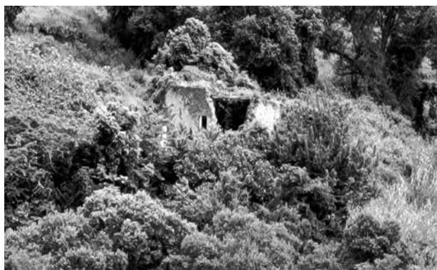
Fotografia de la Casa Vella del Mas Pont avui.