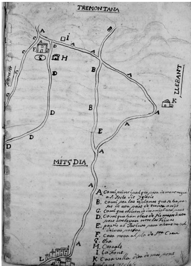
Plànol de l'any 1774 on s'especifica l'ubicació de les edificacions del Mas Pont i els camins que hi passen (Arxiu Família Planet-Graupera)

sous a favor del mariner canetenc Francesc Molet Macip. 2 Això vol dir que Molet li presta 250 lliures a Bataller per a finançar el projecte de construcció. A més, es dona com a aval una peça de terra erma i boscosa pertanyent al quintà del Mas Pont a l'indret anomenat «Santa Creu»; fins i tot, Bataller deixà actuar a Molet com a usufructuari dels terrenys avalats fins que es retorni el censal de 250 lliures.