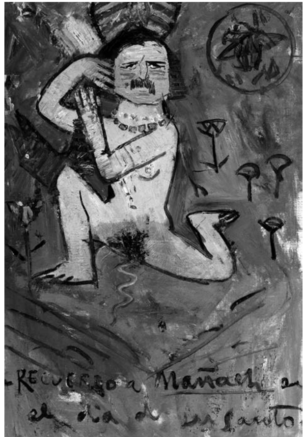
Revers de La Gommeuse de Picasso, amb la caricatura de Pere Mañach.

control excessiu del seu marxant i les pressions que exercia per assolir el nombre de teles pintades que aquest li havia marcat. Malgrat les divergències i l'allunyament, Mañach va fer una nova exposició de amb una quinzena de quadres de Picasso que encara