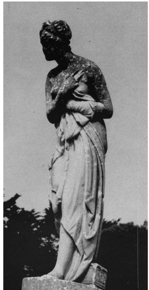
A dalt, el mas Gofau, avui al carrer Josep Baró. A sota, la Plaça del Sol i a la dreta, la venus de Canet, de l'escultor Josep Viladomat, al parc de can Santiñá.