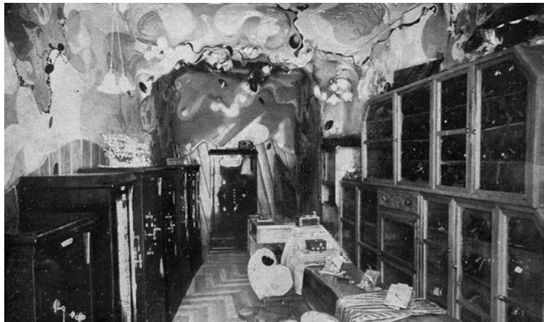
Interior de la botiga Mañach, al carrer Ferran, dissenyada per l'arquitecte Josep M. Jujol.