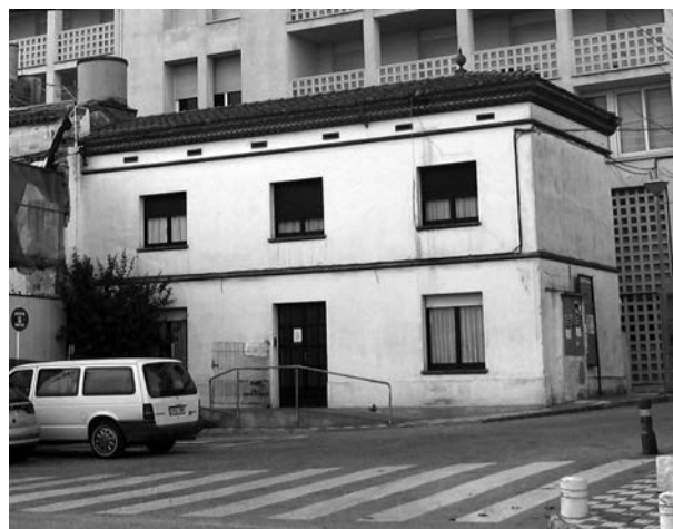
Edifici del Pavelló antituberculós de Canet, que es va enderrocar fa uns anys durant la darrera reforma de l'hospital Residencial Guillem Mas.