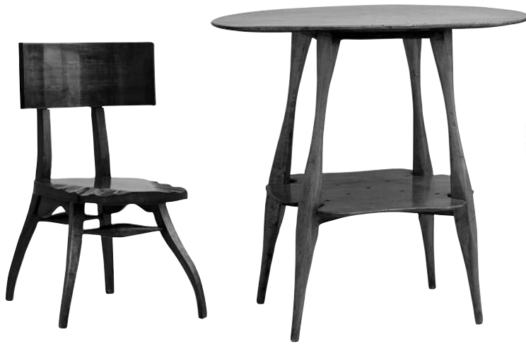
Model de cadira i tauleta del menjador dels Mañach-Ochoa, dissenyat per Josep Maria Jujol, avui al Museu Nacional d'Art de Catalunya. (ANC)