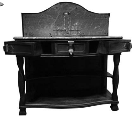
Bufet dissenyat per Jujol, i possiblement per Gaudí, pels Mañach-Ochoa. (Col·lecció privada)

s'acompanyava d'un piano, també decorat amb el mateix estil extravagant, que va desaparèixer durant la Guerra Civil.