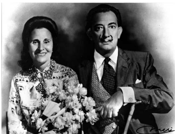
El pintor Salvador Dalí i la Gala