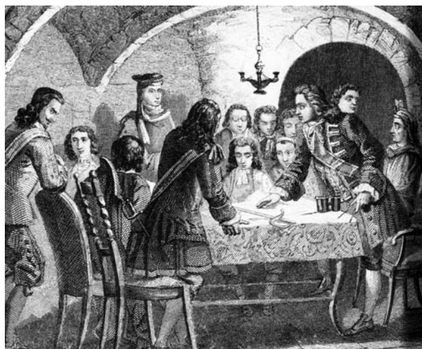
Junta dels Vint-i-Quatre, òrgan de govern de la Barcelona assetjada.

El control militar de la Marina de Llevant era doncs vital pels dos bàndols en lluita, i per això el domini