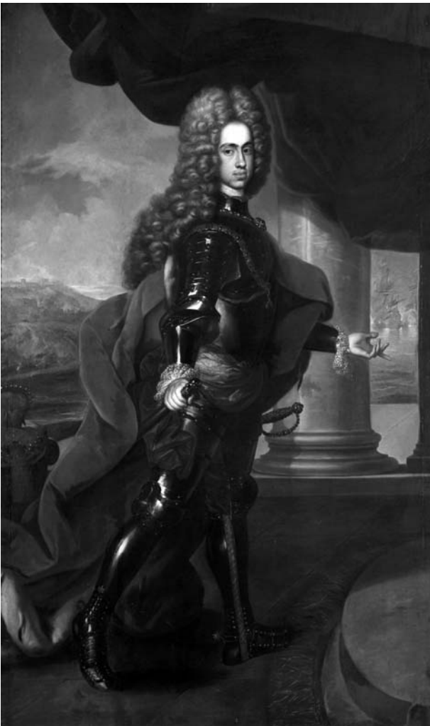
Arxiduc Carles III, rei dels catalans i d'Espanya, posteriorment emperador Carles VI d'Austria.