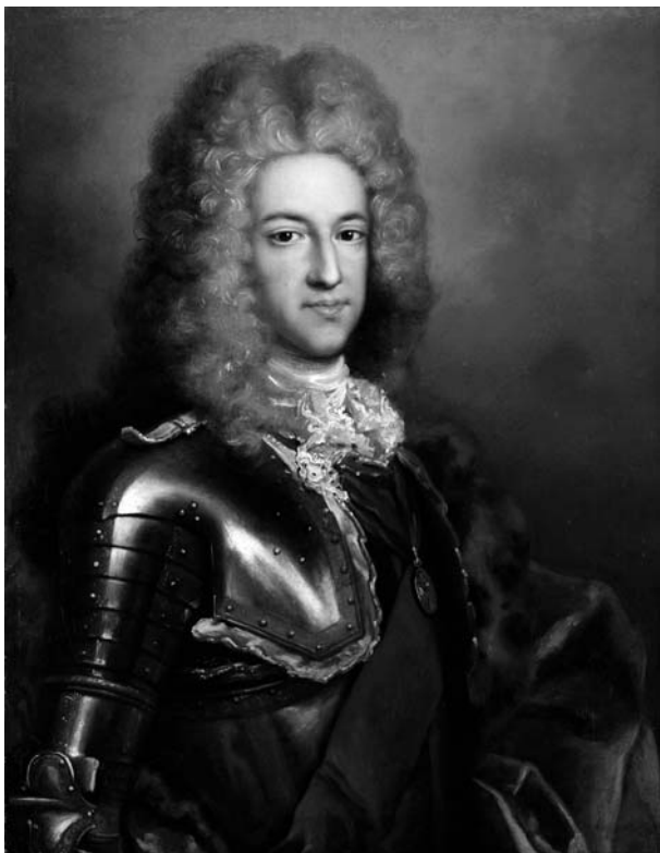
Duc de Berwick, militar anglès al servei de França que va comandar la victòria borbònica sobre Catalunya.