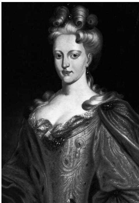
A l'esquerra, Elisabeth Cristina, esposa de l'Arxiduc Carles, va quedar com a governadora de Catalunya entre setembre de 1711 i març de 1713. I a la dreta, les Constitucions de Catalunya, que va publicar el rei Carles III, van ser paper mullat quan va arribar Felip Vè.

provocat per la mort del comandant de la torre de Canet, mort tot just feia un parell de dies. L'endemà de la batussa doncs, el dia 31 de maig de 1714 festivitat del Corpus, van ser penjats de la forca divuit persones als afores d'Arenys, en un lloc que la documentació antiga havia conservat amb els topònims de «Puig Trist» o «Puig de les Forcas». Tots els ajusticiats van ser homes, amb edats compreses entre 18 i 60 anys i majoritàriament pertanyents al sometent d'Arenys. No sabem com va anar la macabra selecció que va