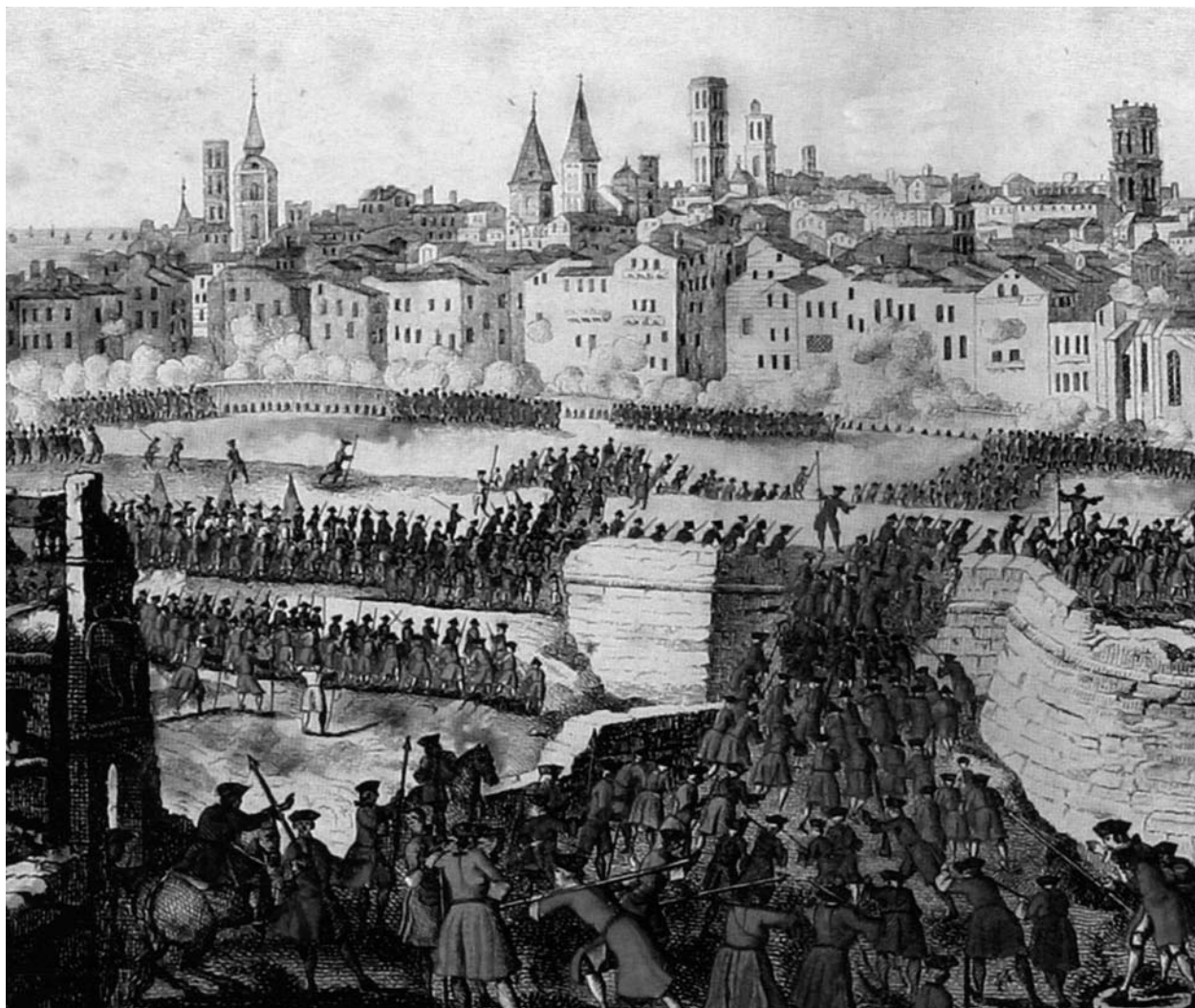
Tropes borbòniques assetjant Barcelona . Onze de setembre de 1714 a les 7 del matí

decidida des del juliol quan el duc de Berwick amb 90.000 soldats francesos i espanyols pren la iniciativa en el conflicte, una investida militar imparabile que acabarà amb la desfeta de l'Onze de Setembre a Barcelona, que tots coneixeu.