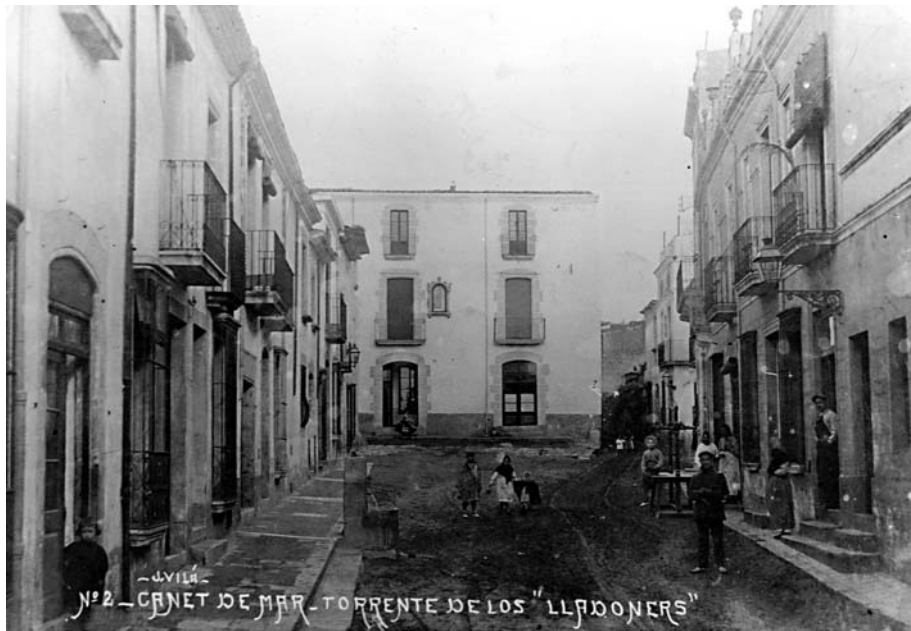
Torrent de Lledoners, a principi de segle XX, on hi havia hagut els lledoners.

Castanyer defensava que els tres lledoners eren propietat de la seva família des de feia moltes generacions i dels quals en deia que «contaban con más de 200 años de antigüedad». 11 Des de sempre els Castanyer havien tingut cura d'aquests tres arbres i en recol·lectaven el seu fruit. I com que els lledo-