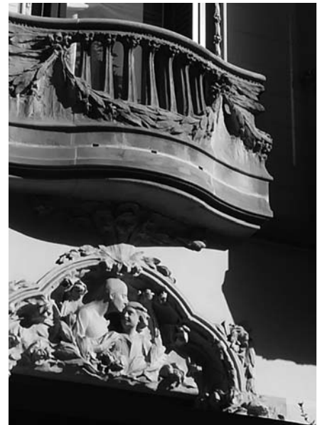
Casa Negra, al passeig de Bonanova, on va passar els darrers anys Amèlia Vivé. A la dreta, detall de la llinda escultòrica de la porta d'entrada a l'habitatge, amb una al·legoria de la caritat, atribuïda a Eusebi Arnau.