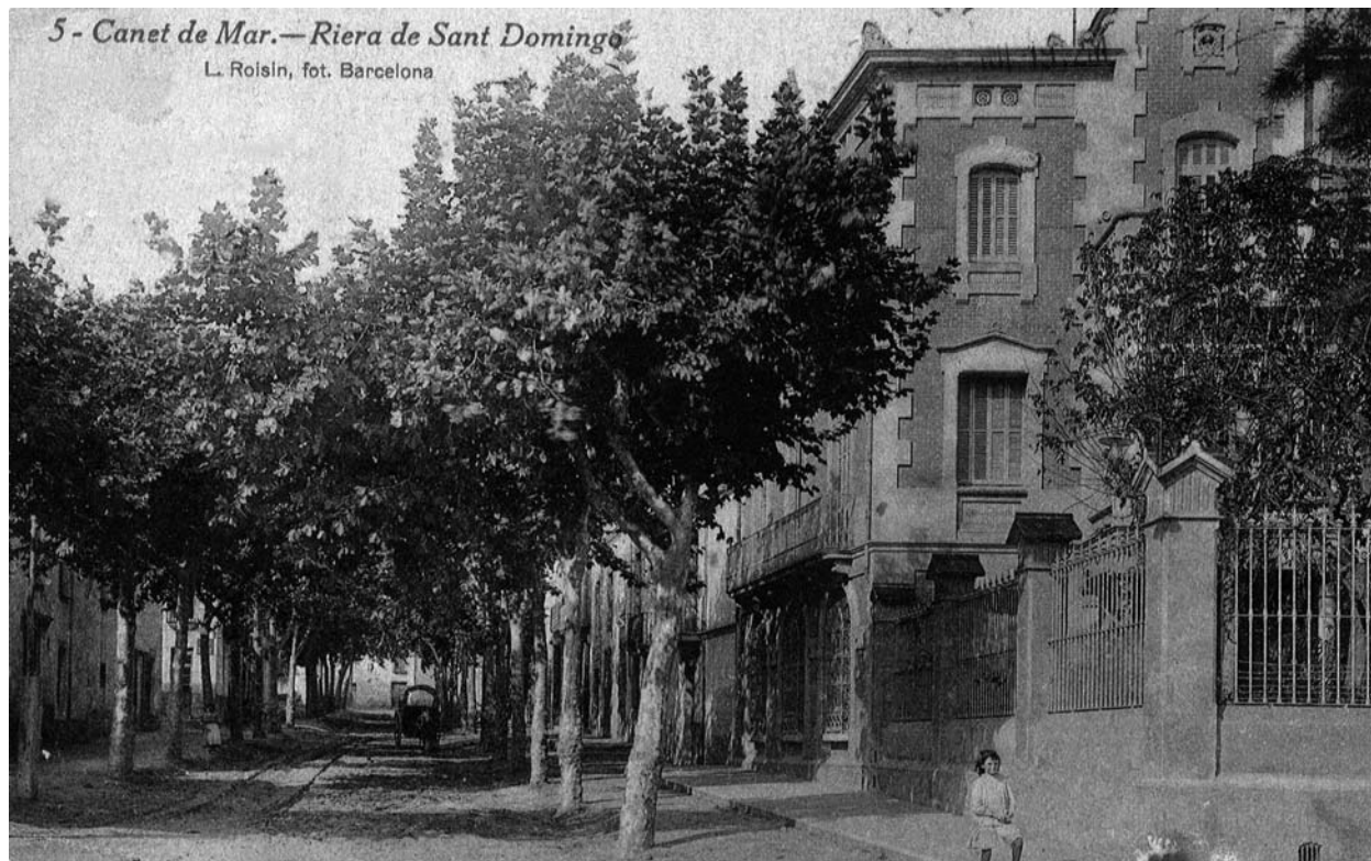
Villa Amelia, a la dreta. La foto és dels anys 10 del segle XX.

que segueixen vivint tots al passeig de Gràcia i que ell «traslada su domicilio a la Ciudad de la Habana y toda la demás familia a la Villa de Canet de Mar». 20