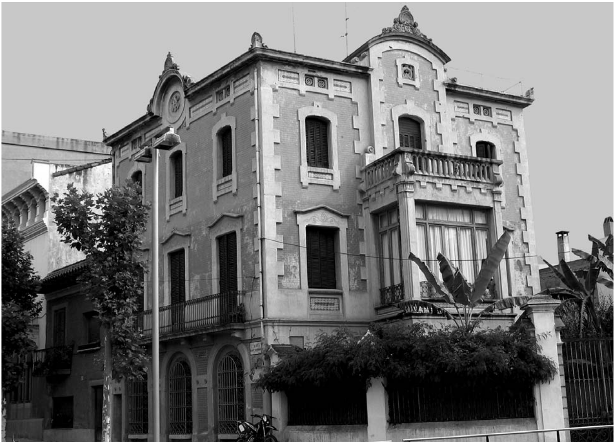
Villa Amelia, avui. (Francesc Arcas)

iniciatives, entre d'altres, pel març de 1901, a la vetllada benèfica per recaptar fons per construir el monument, Vivé va presentar la poesia «Del mar al cel». 32