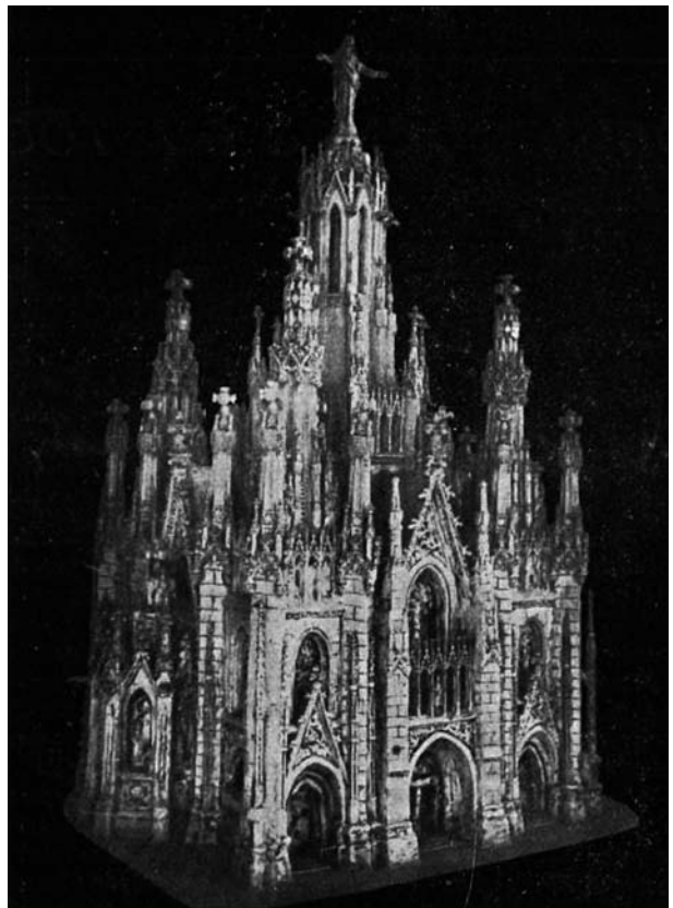
Maqueta del temple del Tibidabo, publicada a la revista Oro de Ley el 1911.