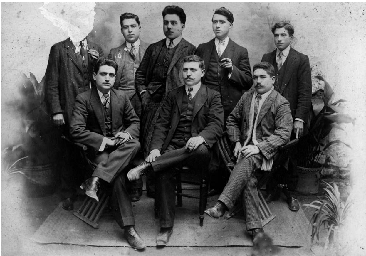
Components de l'orquestra canetenca d'Els Quirretes. Any 1911.