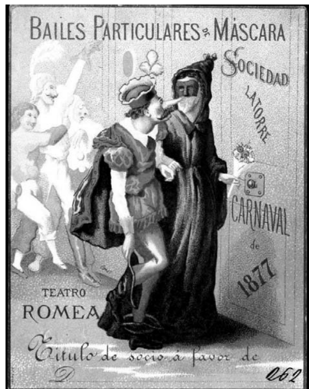
Cartell d'un ball de Carnestoltes de 1877 al Teatre Romea de Barcelona.

La referència podria haver estat breu, però amb aquell tarannà burocràtic que ens caracteritza, tot va acabar com sempre: amb baralles, empresonaments i la presència del notari.