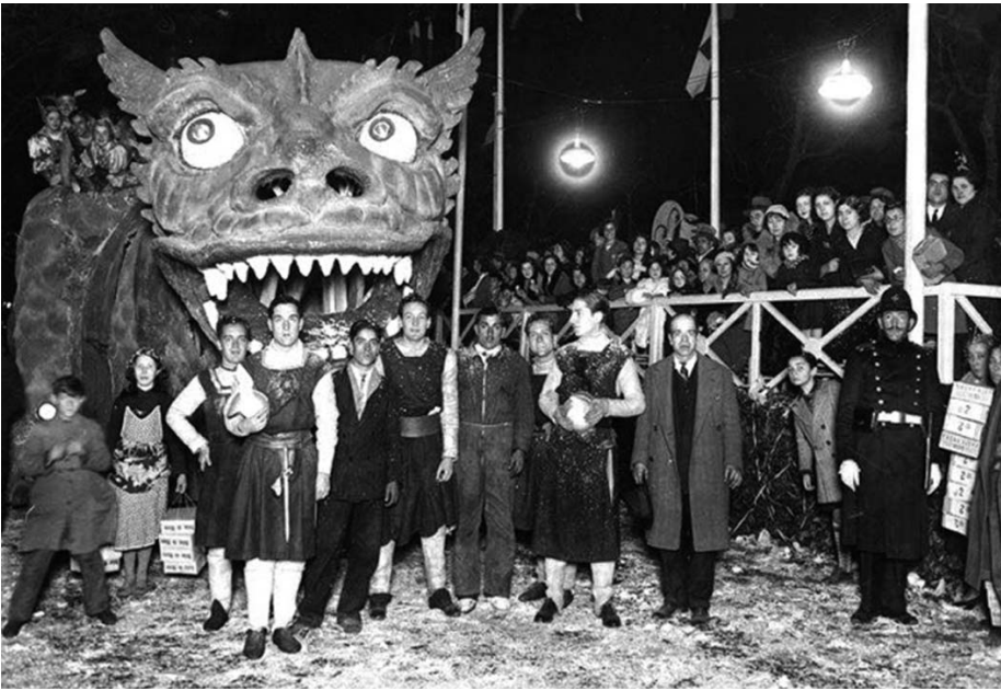
Imatge d'una de les colles de Carnestoltes de Barcelona de l'any 1929.

allò era un verdader desori i tothom se divertia, uns esbroncant i altres essent esbroncats. Ara, lo del carrer s'ha reclòs dintre les sales de ball i tot el luxe i la vanitat se guarda per a la nit: per la passada. I s'hi gasten un dineral, perquè d'atxes no n'hi ha pas de bon tros tantes en les processons de la Setmana Santa. Les societats buiden les bosses i els socis les ajuden: la qüestió és veure qui guanyarà, i el guanyar suposa qui portarà més atxes, que tot plegat vol dir: gana pels cerers, que enguany la tenen completa, car hi ha vingut un carro d'Arenys de Mar i se n'han endut totes les atxes encetades que ha trobat, lo que demostra també que els nostres veïns se diverteixen. Doncs sí, tant lo Foment com la Unió, volent lluir-se, rivalitzen per cridar l'atenció i no escatimen gasto; la primera té l'orquestra canetenca Los Quirretes, i la segona la banda La Lira Barcelonesa, i demostrant-se que si la banda és molt bona anant pel carrer, perd condicions a dintre una sala, puix per ballar, los instruments de vent no són los més a propòsit per a ésser tocats».