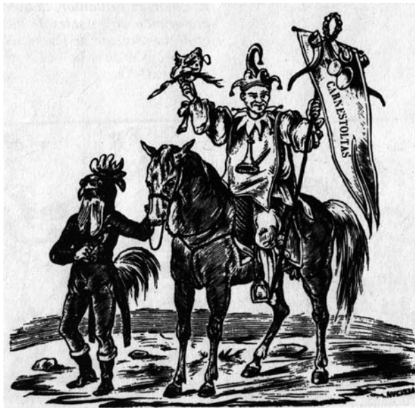
Gravat de la figura del Carnestoltes de finals segle XIX.

L'endemà era el Divendres de Carnestoltes , dia per excel·lència de l'arribada del personatge Carnestoltes, el rei del Carnaval. Aquest, essent un representant incògnit de la societat, amagat rere la disfressa, solia llegir el «Sermó» amb grans dosis satíriques, especialment contra les autoritats municipals.