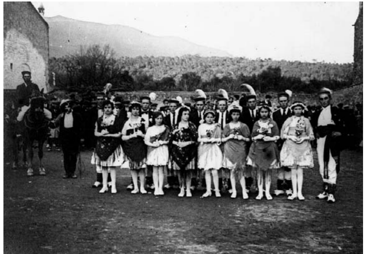
Grup de balladors del "Ball de Gitanes". Sant Esteve de Palautordera 1913. (Fons Bonet Garí - Centre Excursionista de Barcelona).

A continuació oferim un recopilatori de les anotacions amb més interès o rellevància. Com es podrà veure, l'estructura ja era molt més ben definida. La gent participava activament a les festivitats amb presència als locals socials de més afinitat. Ja havien sorgit les iniciatives polítiques, i les seus de les esquerres i les dretes comencen a competir per qui realitza les millors vetllades, o qui té capacitat de llogar la millor orquestra.