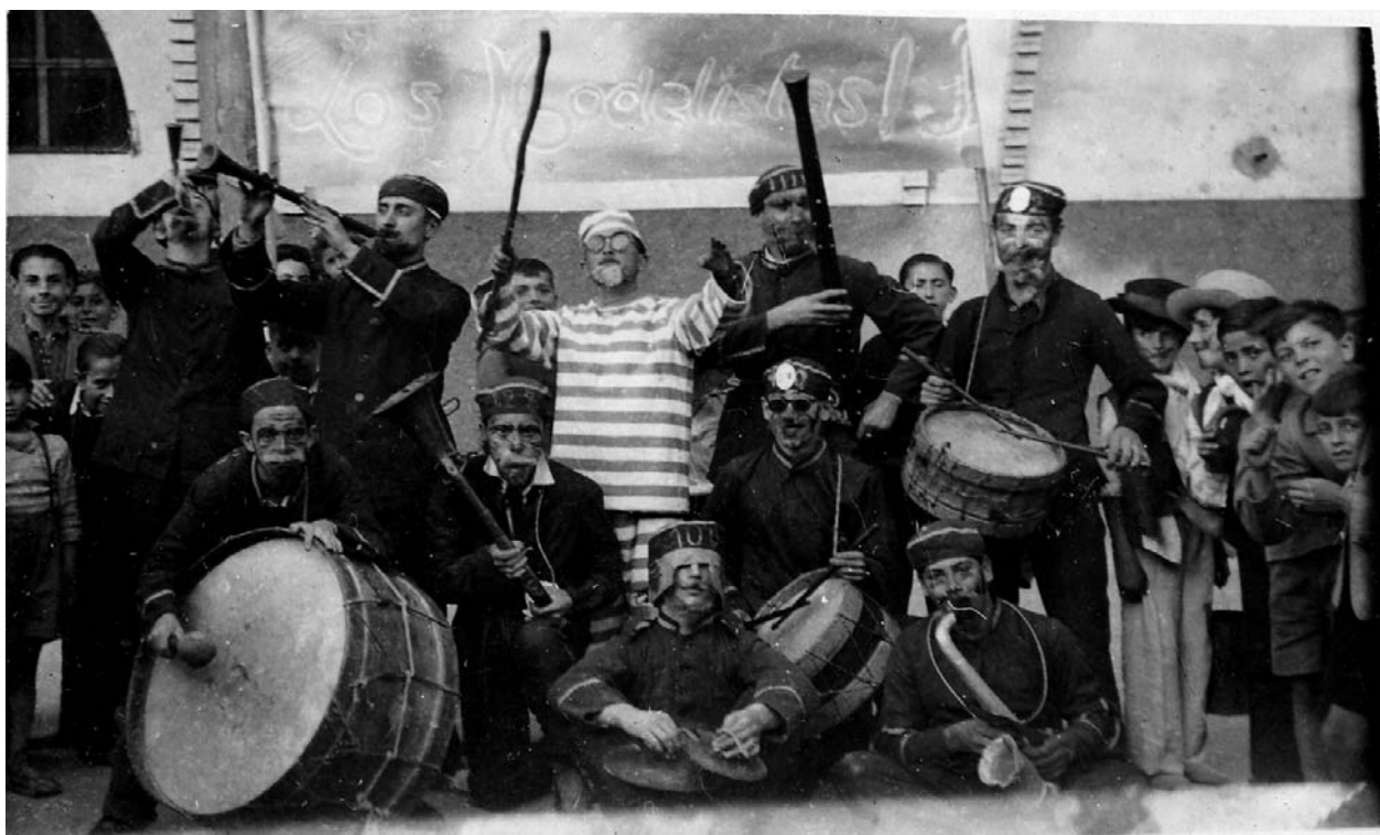
Grup de canetencs disfressats a la plaça Colomer. Primera meitat de la dècada de 1930.

«que era constante havia él ordenado hacerse el dicho pregón pero que ignorava si el portero (l'agutzil) havia hecho relación del citado pregón». Els declarants van afegir que ells no havien sentit res, i que «hablaban de los días de antes de ayer, pues que ni hoy ni ayer han oído ellos declarantes hacerse pregón alguno, ni saber se haya hecho» 2 .