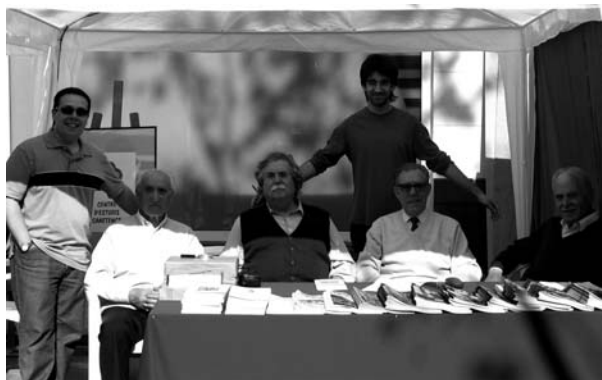
Estand del CEC a la Mostra d'Entitats 2005.

Tenia un caràcter pacífic i una bondat natural, com poques vegades se'n troben en aquesta vida. Els seus companys i amics del Centre d'Estudis Canetencs el trobarem a faltar. Que descansis en pau.