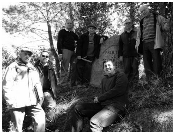
Sant Pere de Romeguera, any 2012.