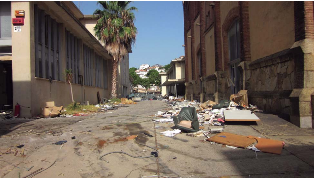
Pati Can Jover. Estiu 2012

de fil (eren aquells carros que es feien servir a Can Jover per posar les prenes confeccionades); m'hi vaig acostar i vaig encetar una conversa intranscendent amb aquells camàlics, preguntant si tot aquell material s'aprofitaria o anava llençat, em van confirmar la sospita: tot allò anava a reciclar, vaig demanar si podia fer unes fotos del interior i em van dir que fes el que volgués, que ells marxaven, ja tenien el camió ple i havien d'anar a descarregar. Com sigui que les portes de l'edifici restaven obertes de bat a bat hi vaig entrar.