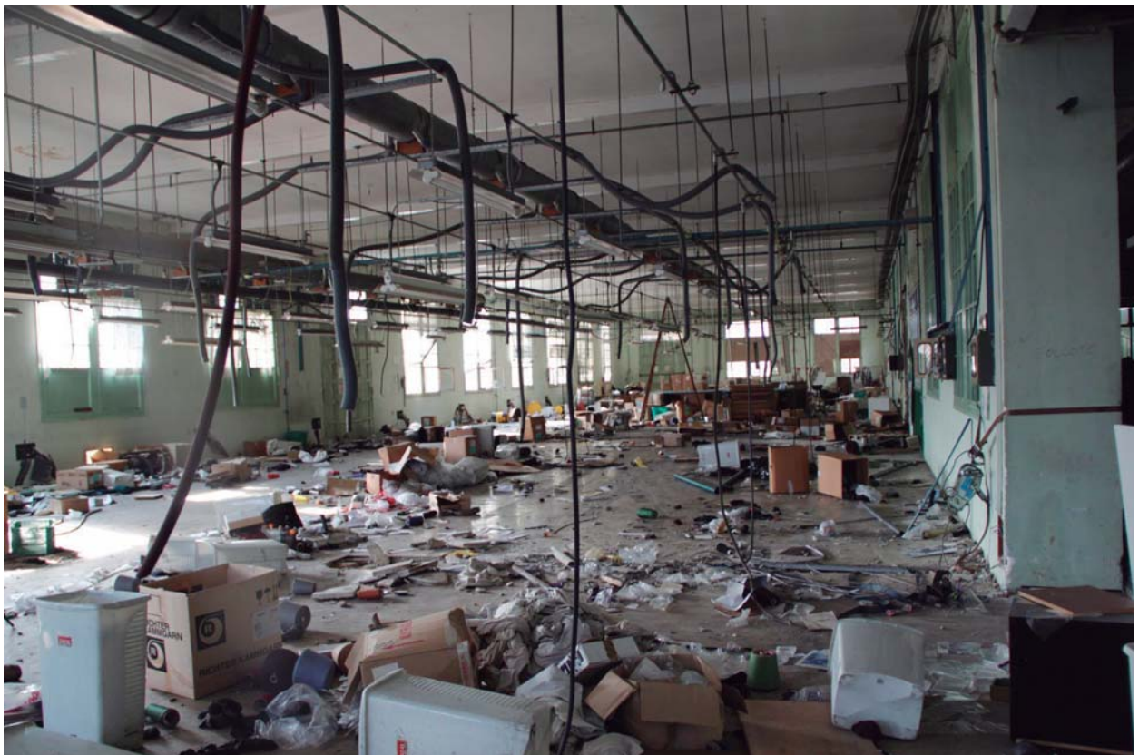
Secció de confecció

referència a la temporada també la portaven tamponada moltes de les etiquetes: anys 30's, 40's, 50's i 60's; no hi havia cap dubte sobre la naturalesa d'aquell material i la seva antiguitat. Vaig fer-ne una petita selecció, recollint per terra