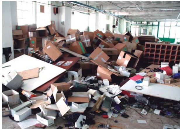
Secció de confecció

Fent una valoració final d'aquell desgraciat afer, una crítica s'imposa; sense ànim de dubtar de la bona fe dels responsables polítics d'aquell moment, podem afirmar amb total rotunditat que el desmantellament de Can Jover és va fer malament des del començament. Segurament per desconeixement, qui va tramitar l'expedient que autoritzava el desmantellament de la Fàbrica Jover,