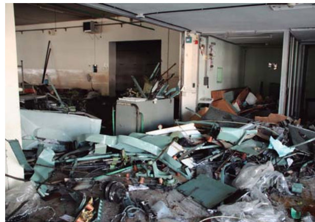
Restes de maquinària convertida en ferralla