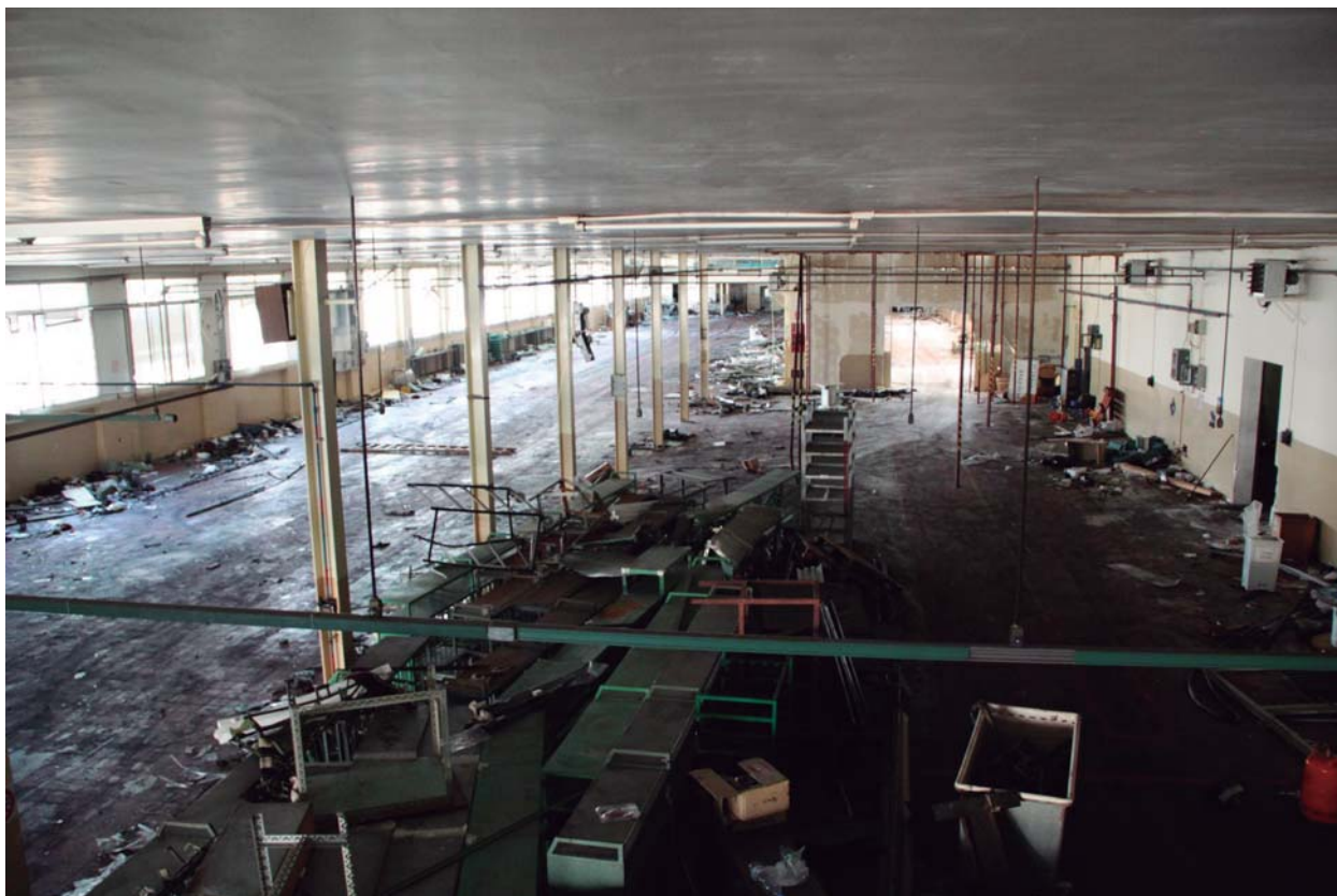
Secció de cottons