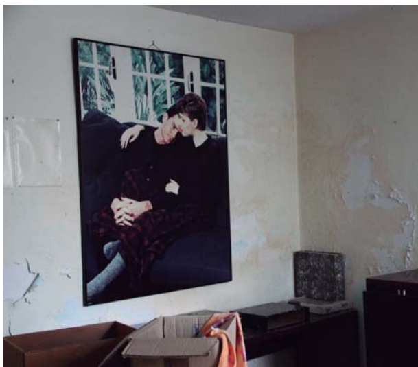
La bellesa enmig de la destrucció