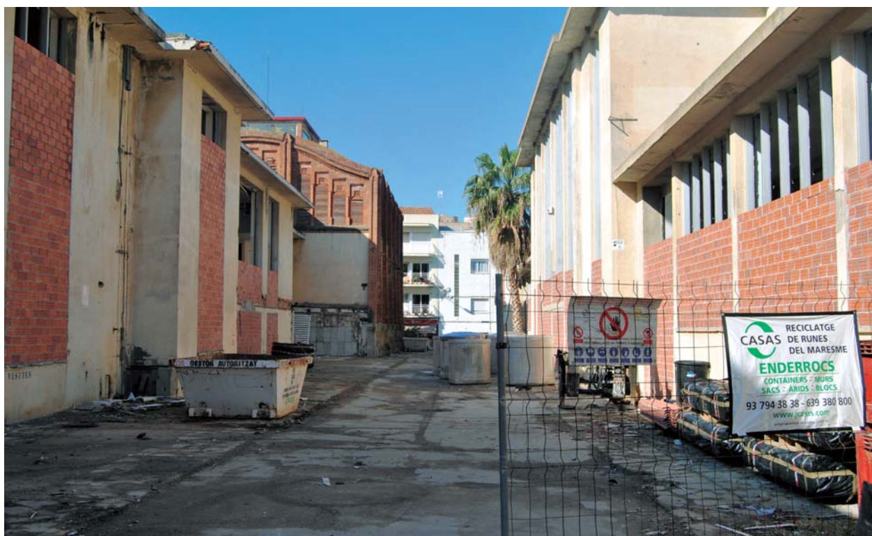
Tapiat final de les instal·lacions

sense restriccions, no va seguir els protocols habituals que tenen establerts, per aquests casos, poblacions amb més experiència i tradició industrial: Barcelona, Badalona, Sabadell, Terrassa, Mataró, Igualada, Olot, etc., ciutats on no s'autoritza cap desmantellament fabril si abans no hi han passat els tècnics municipals, responsables del patrimoni local; per valorar i preservar, si s'escau, aquells elements materials i documentals que pertanyen al patrimoni col·lectiu del poble. Hem