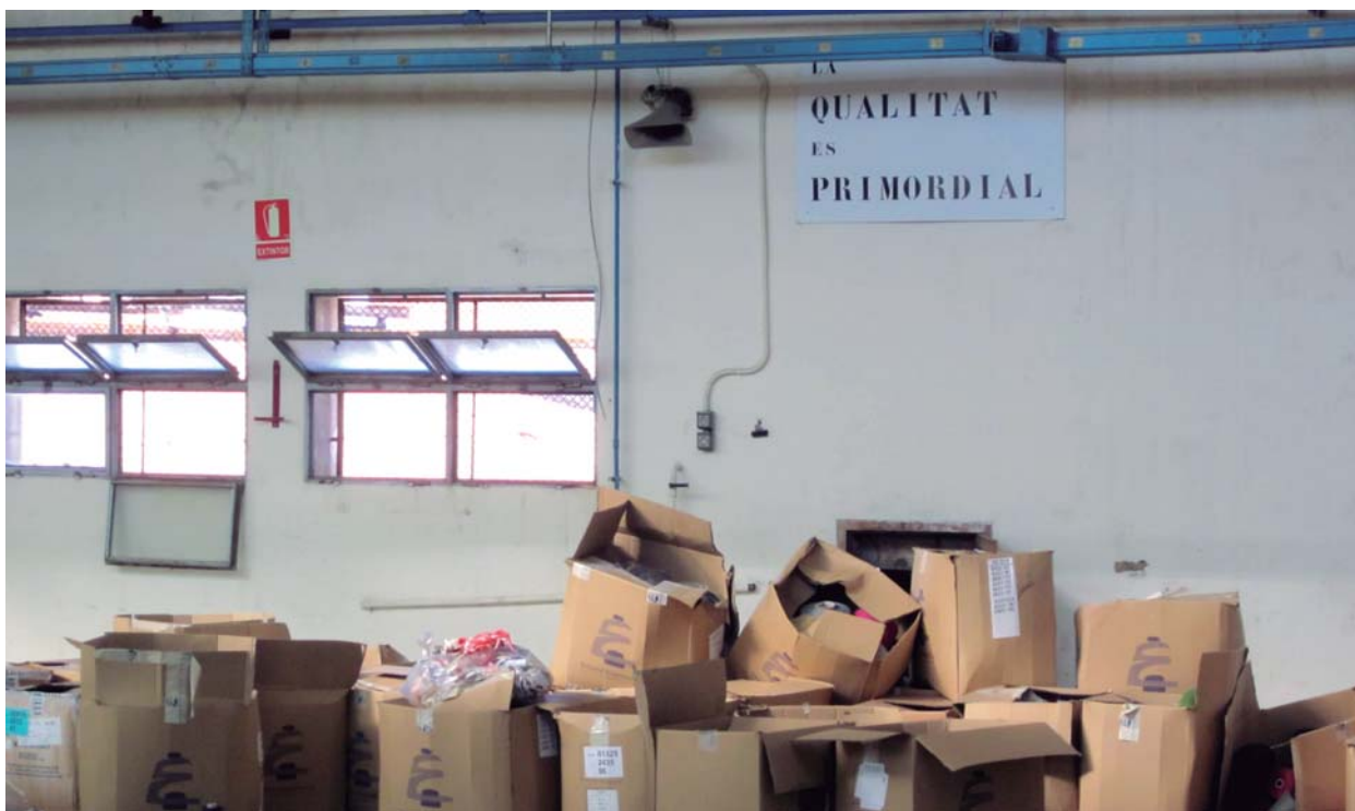
Fins al final el lema va ser: «La qualitat és primordial»