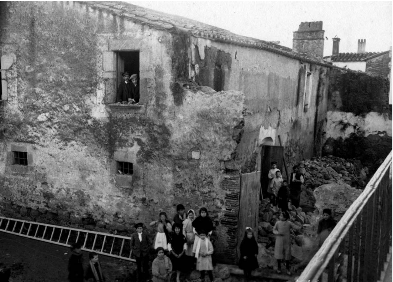
La Casa Macià, durant l'enderroc de 1915. (BPGP)