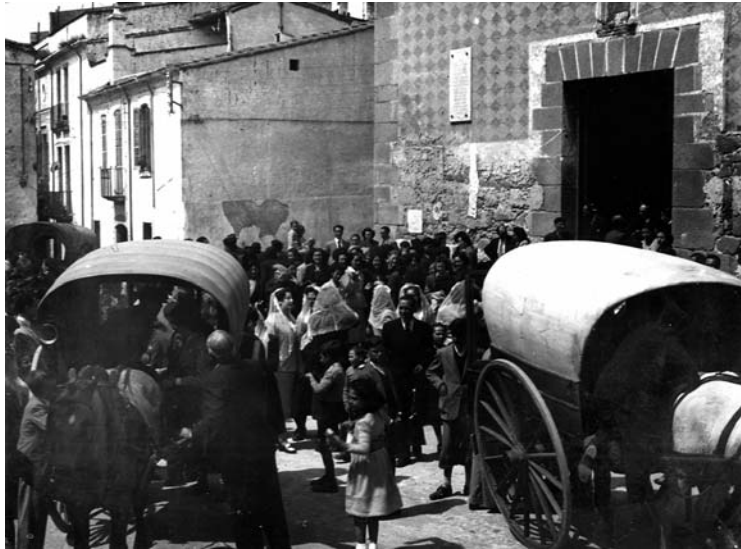
Sortida de missa durant les primeres dècades de segle XX.