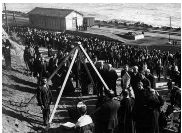
Dues de les fotografies que es conserven de la posada de la primera pedra de l'Hospital dels Pobres, de 1915. (BPGP)