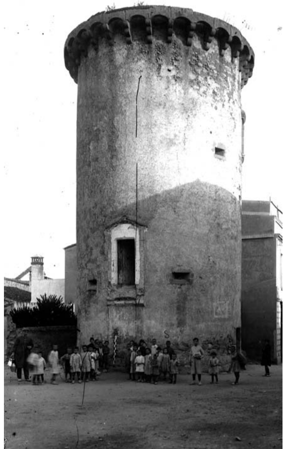
La Torre Macià, una vegada s'enderrocà la casa. (BPGP)