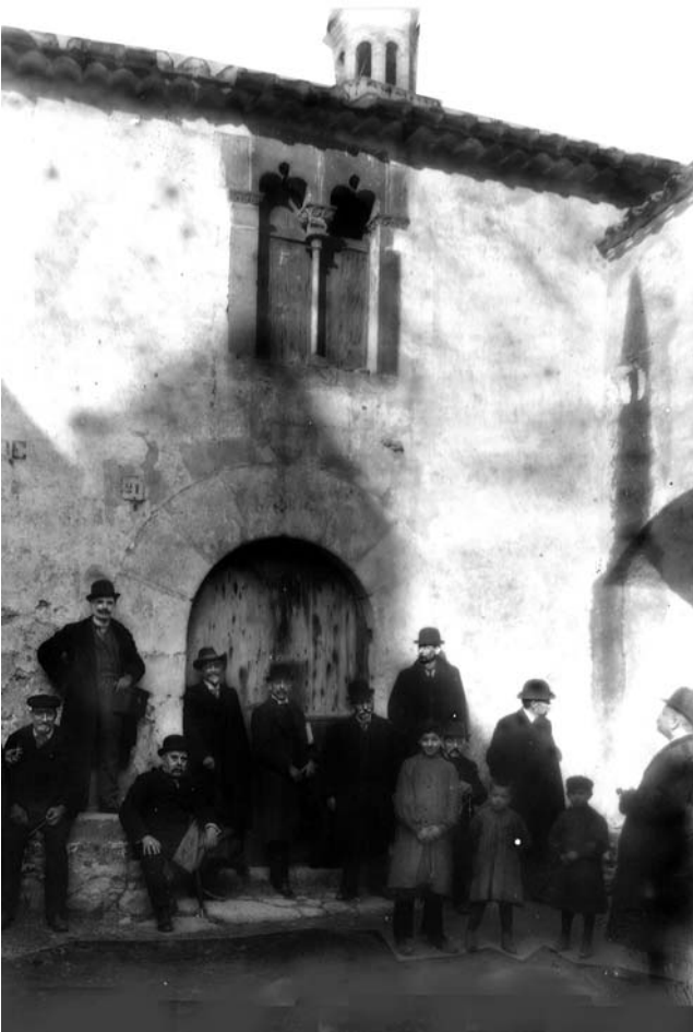
Imatge de la façana de la Casa Macià, abans del seu enderroc