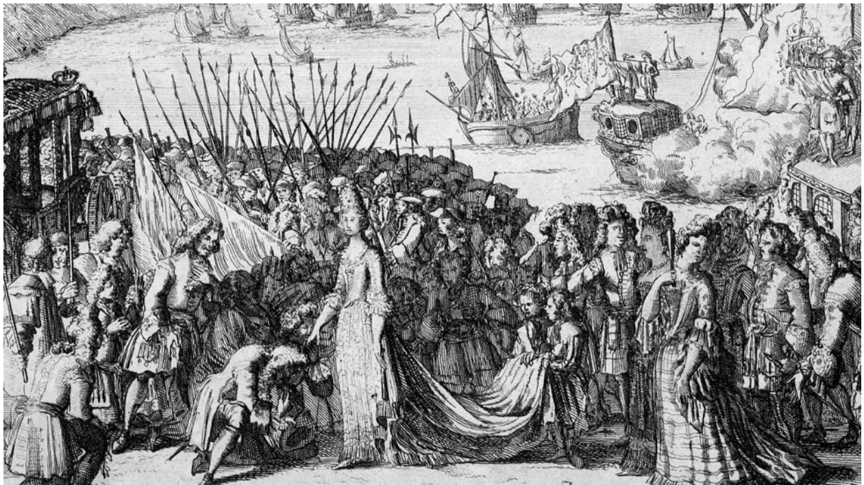
Arribada de la futura Arxiduquesa Elisabeth Cristina de Brunsvi-Wolfenbüttel a Mataró, el 25 de juliol de 1708

1704 s'observà, fins més enllà de la Serralada, la caiguda espectacular d'un meteorit, anunciant evidentment grans calamitats, conseqüència de la participació, en un o altre bàndol, en la Guerra de Successió (1702-1714). Queda, per tant, constatat que el sistema de transmissió oral d'aquesta notícia ha perdurat al llarg de 310 anys. No està pas malament.