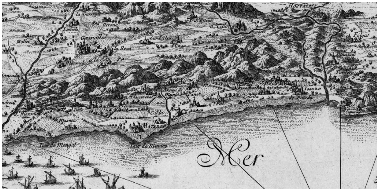
Fragment d'un gravat de 1697 on es pot veure els pobles del Maresme poc abans de la Guerra de Successió